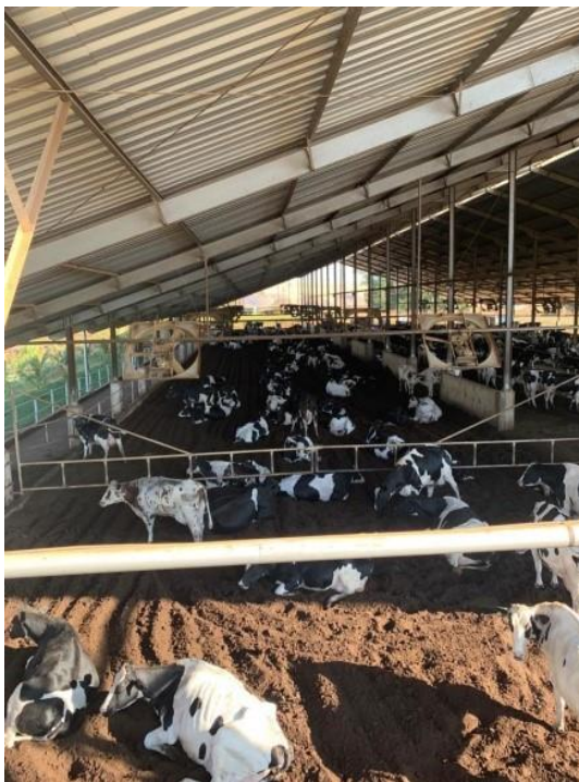
Imagem 2 – Observa-se um Compost Barn, onde as vacas doadoras de oócitos estão alojadas.

Na imagem 2, observa-se o conforto dos animais doadores de genética em seu espaço físico, um Compost Barn :