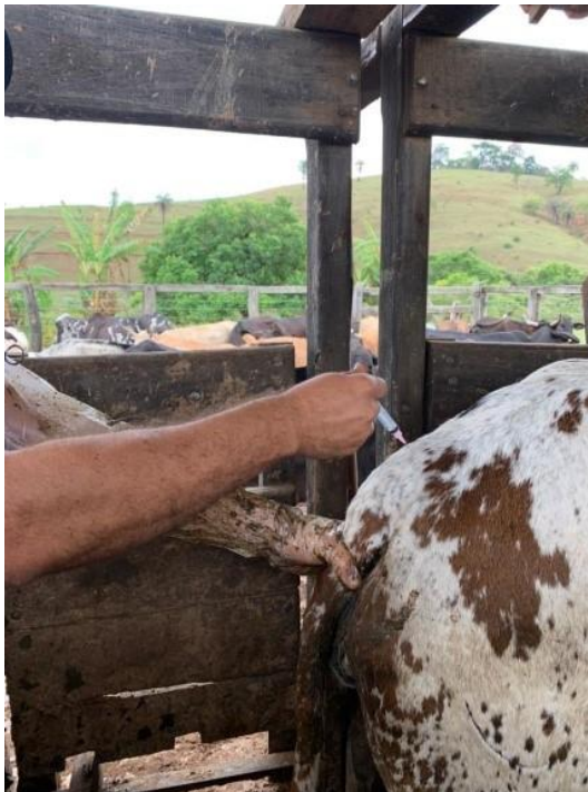
Imagem 3 – Observa-se a aplicação de anestesia epidural caudal.

A imagem 3 podemos observar a aplicação de uma anestesia epidural caudal em uma fêmea, procedimento realizado para facilitar o procedimento de Transferência de Embrião como também para a Aspiração Folicular.