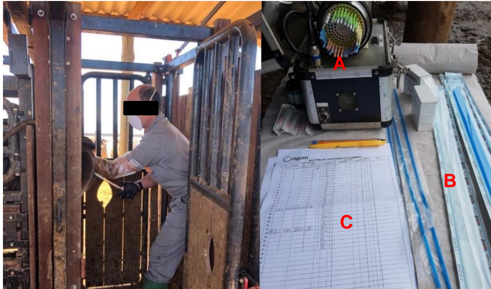
Imagem 3: Transferência de embriões. Materiais utilizados: A- Transportadora de embriões; B- Bainha para inovulador; C- Planilha de controle dos animais.