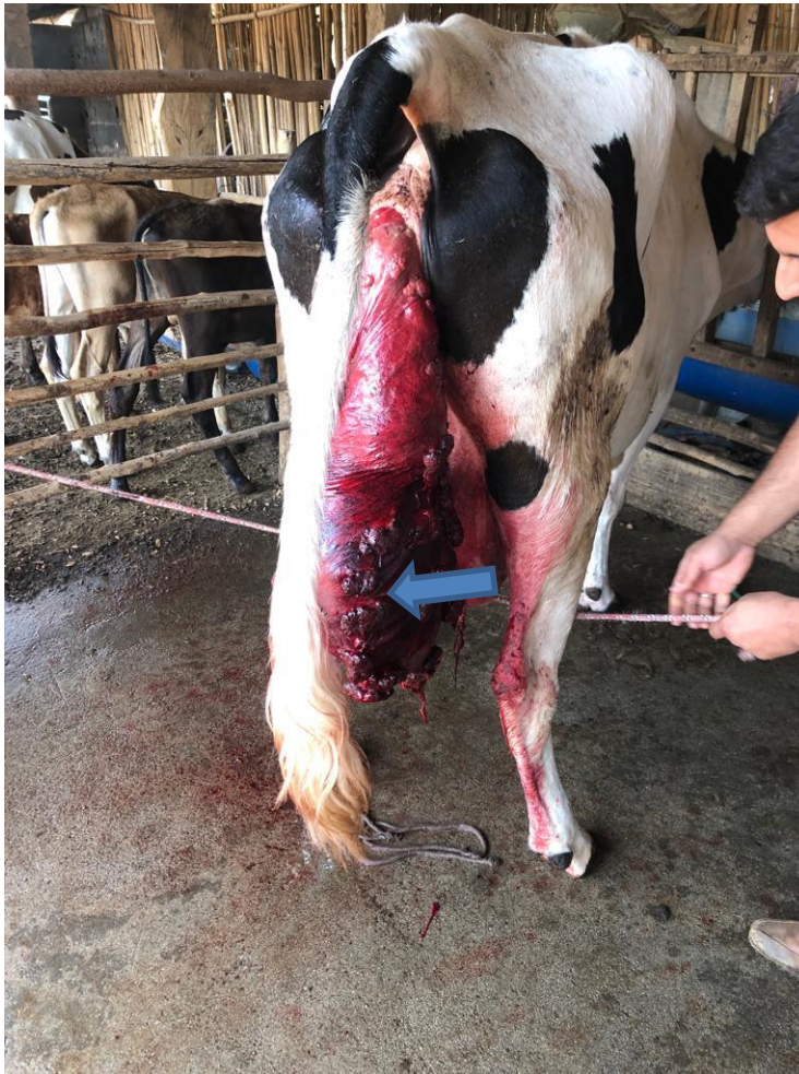
Imagem 4: Prolapso Uterino. Útero prolapsado (seta azul)