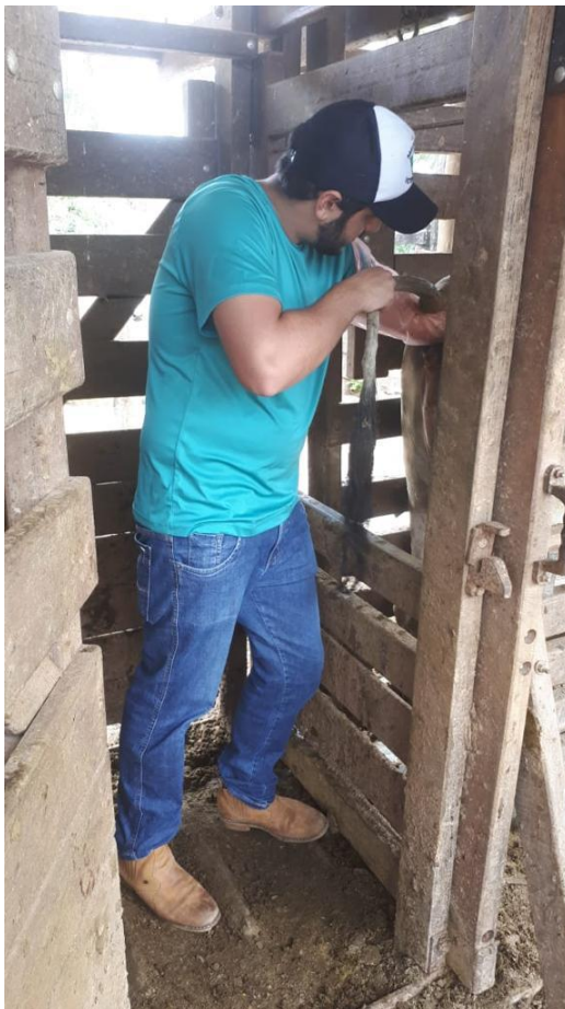
Figura 1: Palpação retal.

Na imagem 1 podemos observar como é realizada a palpação retal para diagnóstico gestacional em bovinos.