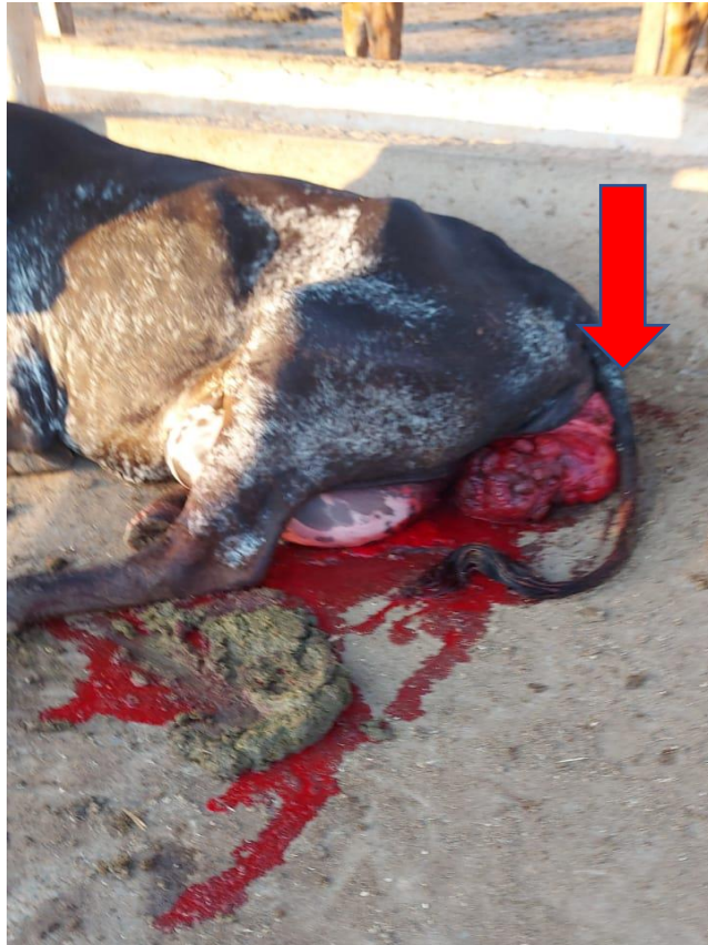
Imagem 1: Prolapso uterino (útero exteriorizado – seta). Animal em decúbito esternal e com hemorragia.