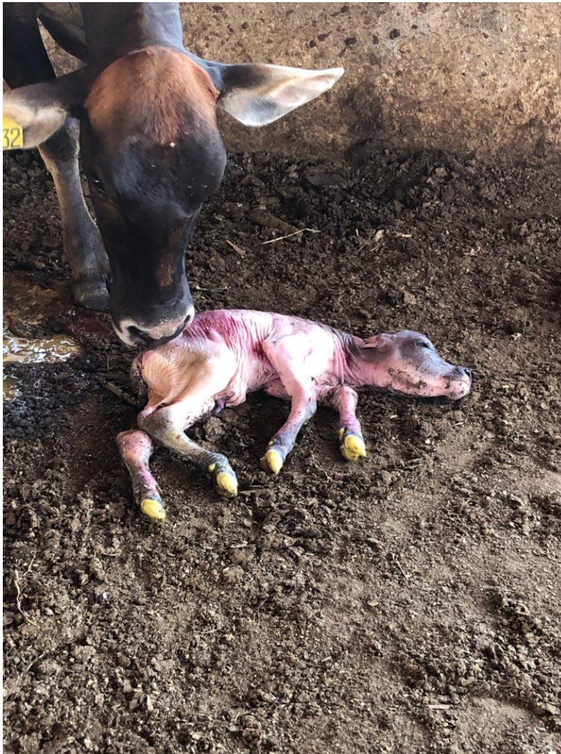
Imagem 5: Aborto bovino de 6 meses de gestação.