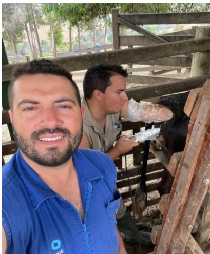
Imagem 1 – Introdução de guia de OPU guiada por ultrassom, sob a supervisão do Médico Veterinário.

Na imagem 1 podemos observar a coleta de oócitos de uma fêmea de alto valor genético.