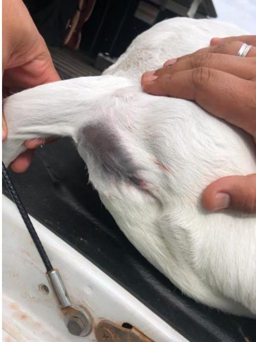
Foto 2: Paciente durante os procedimentos pré-operatórios, sem a presença do ânus.