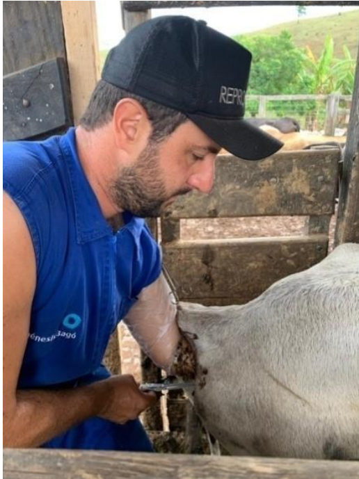
Imagem 4 – Inovulação do embrião para o animal receptor.