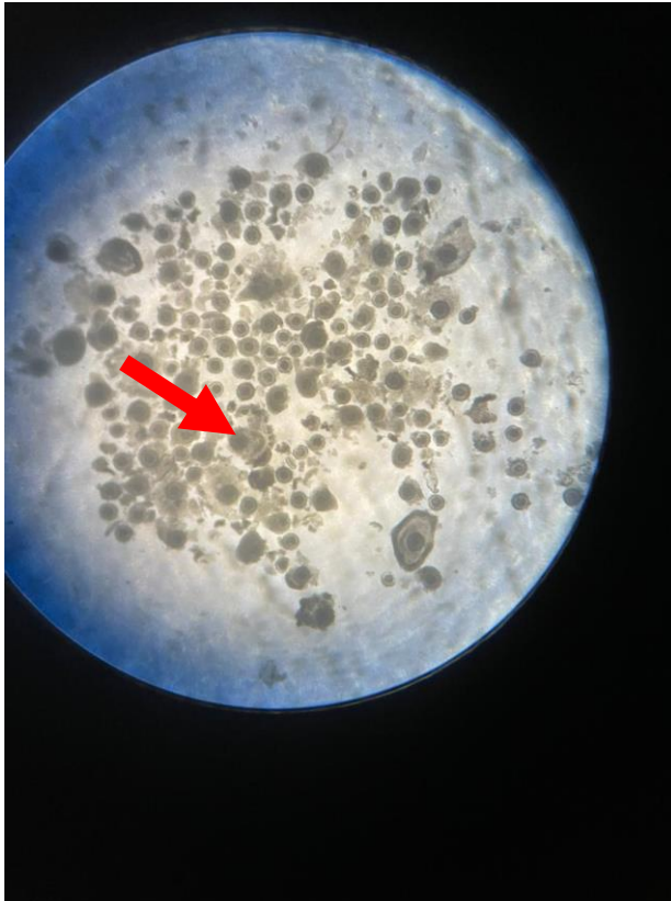
Imagem 5 – Seleção e classificação de oócitos (gametas feminino).