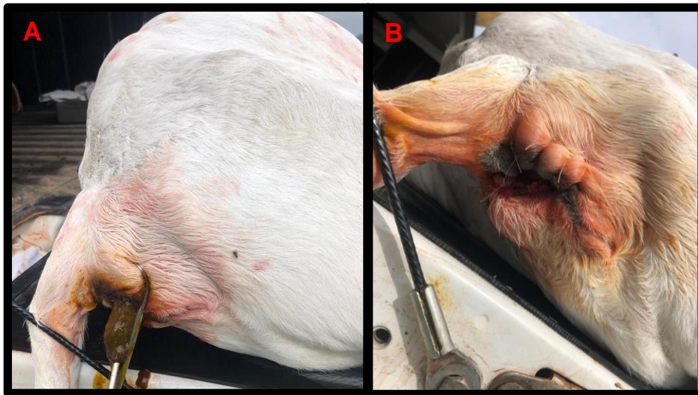
Foto 3: A- Fezes exteriorizadas após abertura do reto. B- Ânus após realizar as suturas.

(Silverbac Prata®) para proteger a ferida cirúrgica, evitando assim a formação de miíase.