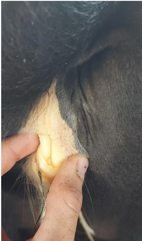
Foto 4: Mucosa vulvar característica de Tristeza Parasitária Bovina.