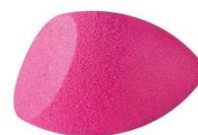
01 esponja de gota chanfrada para maquiagem