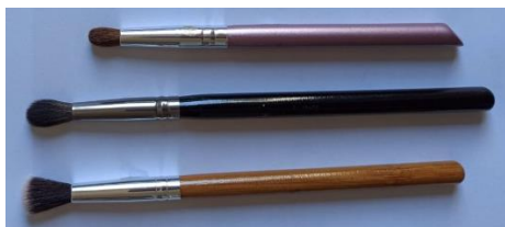
03 pincéis para esfumar sombra (grande, médio e pequeno)