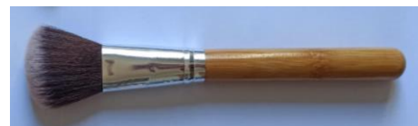
01 Pincel para contorno