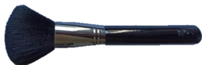
01 Pincel para pó grande