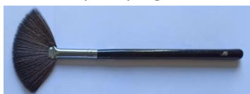
01 Pincel para iluminador