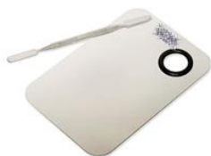
01 Kit de placa e espátula para maquiagem