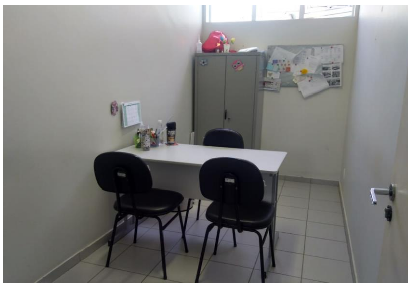
Figura 4 - Sala de atendimento da Psicologia.

Os atendimentos são feitos pela psicóloga responsável e pelas estagiárias.