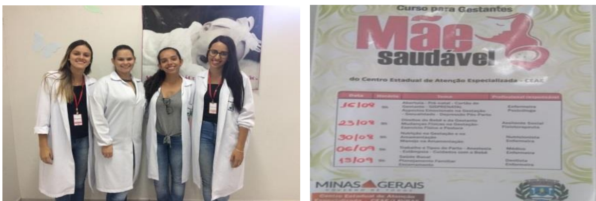
Figura 6 - Grupo “Mãe Saudável”.