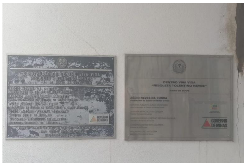
Figura 1 - Placas de construção e inauguração do Centro Viva Vida Risoleta Tolentino Neves.