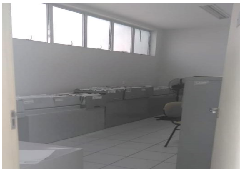
Figura 5 - Sala onde os prontuários dos pacientes são arquivados.