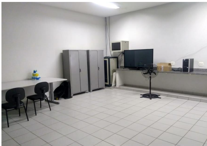
Figura 7 - Sala de Reunião.

Nesta sala de reunião acontecem os grupos “Mãe Saudável”, grupo de funcionários, grupo de vasectomia e alguns seminários.