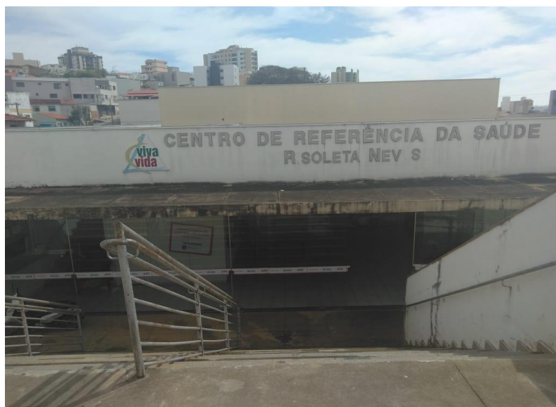
Figura 2 - Faixada do Centro Estadual de Atenção Especializada (CEAE).