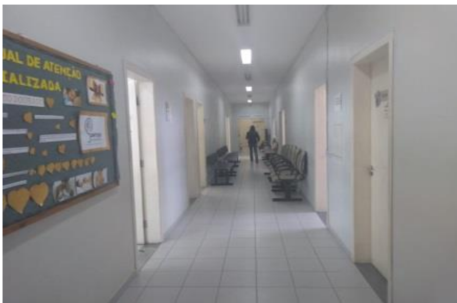
Figura 8 - Corredor principal do CEAE.

A figura retrata o corredor onde os pacientes aguardam o atendimento. Todas as salas da equipe multiprofissional estão presentes nesse local.