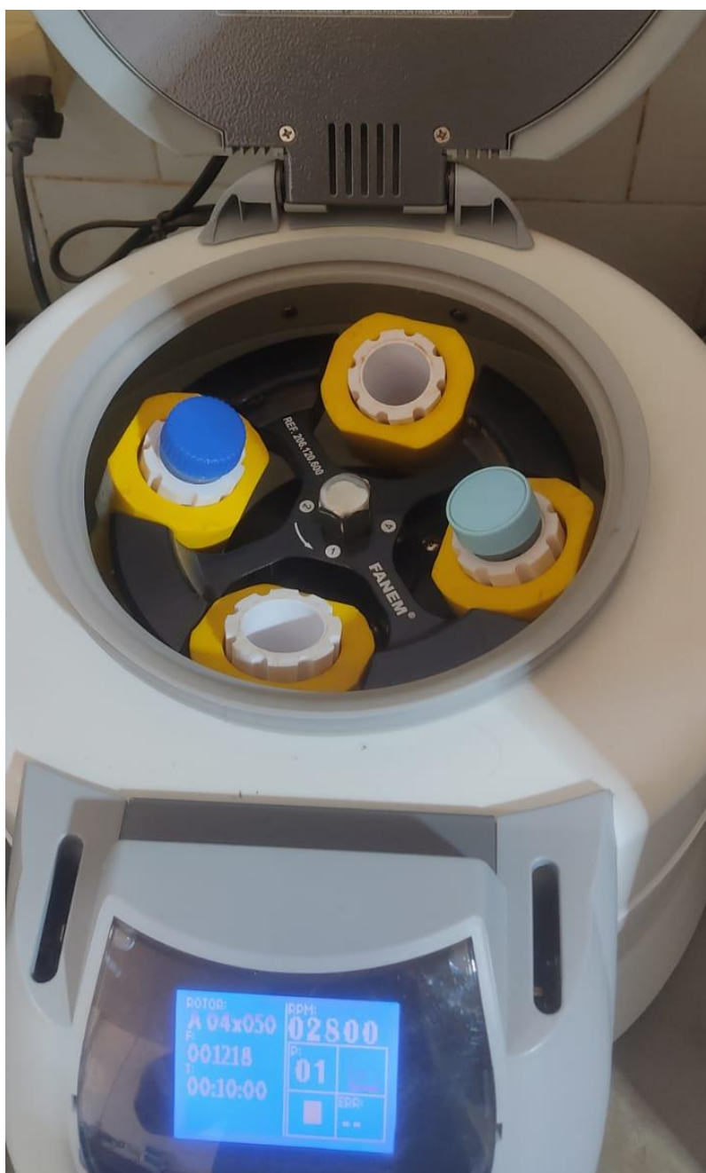
Figura 3- Processamento do ejaculado utilizando centrífuga.

A amostra contendo o sêmen e o diluidor é processada utilizando uma centrífuga Tecnal NT-810 (Figura 3) para separar o plasma seminal dos pallets de espermatozóide que após a centrifugação ficam concentrados no fundo do Tubo de Falcon.