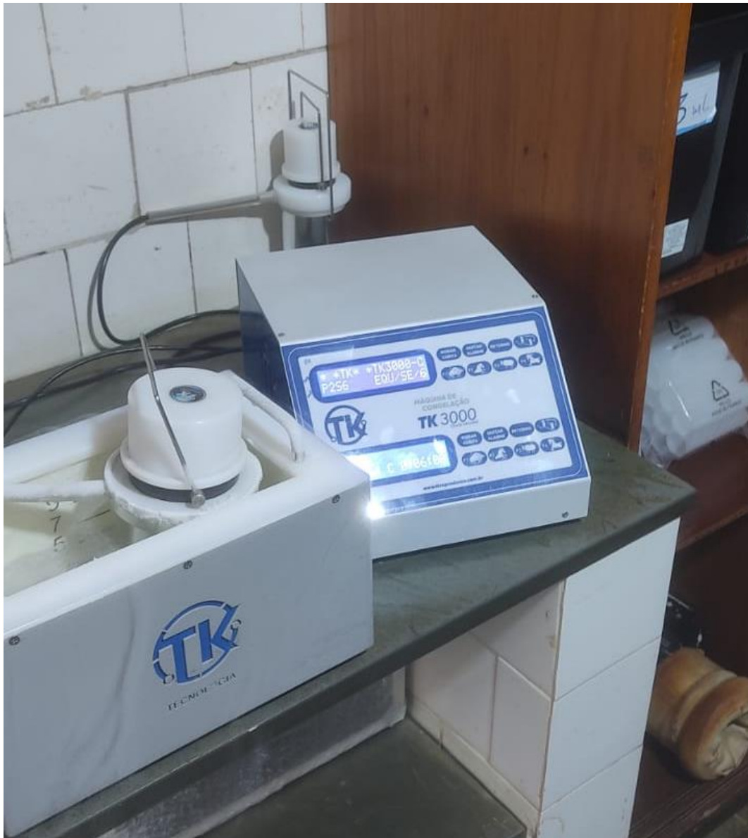
Figura 6- Equipamento utilizado para o congelamento de sêmen.