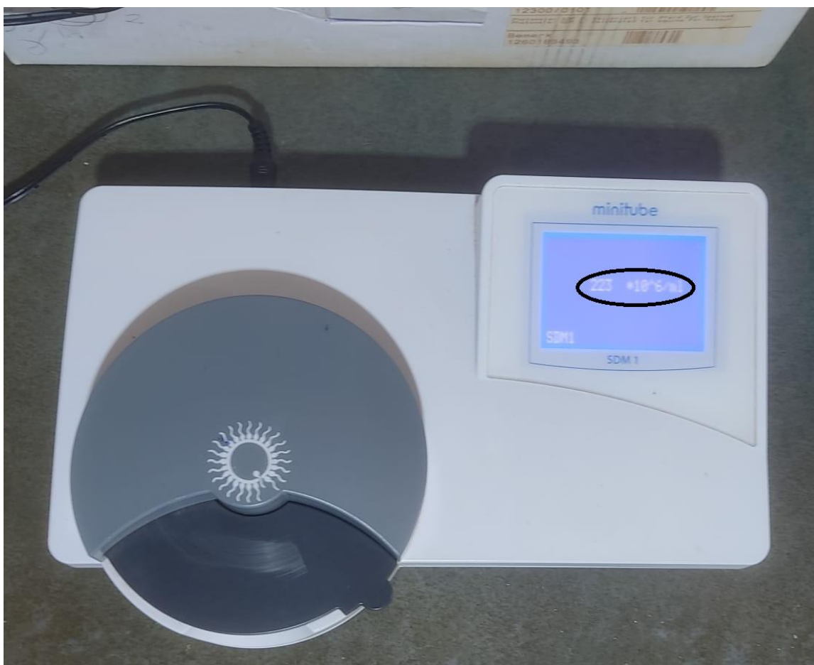
Figura 1- Fotômetro Minitube utilizado para análise de concentração espermática do sêmen.