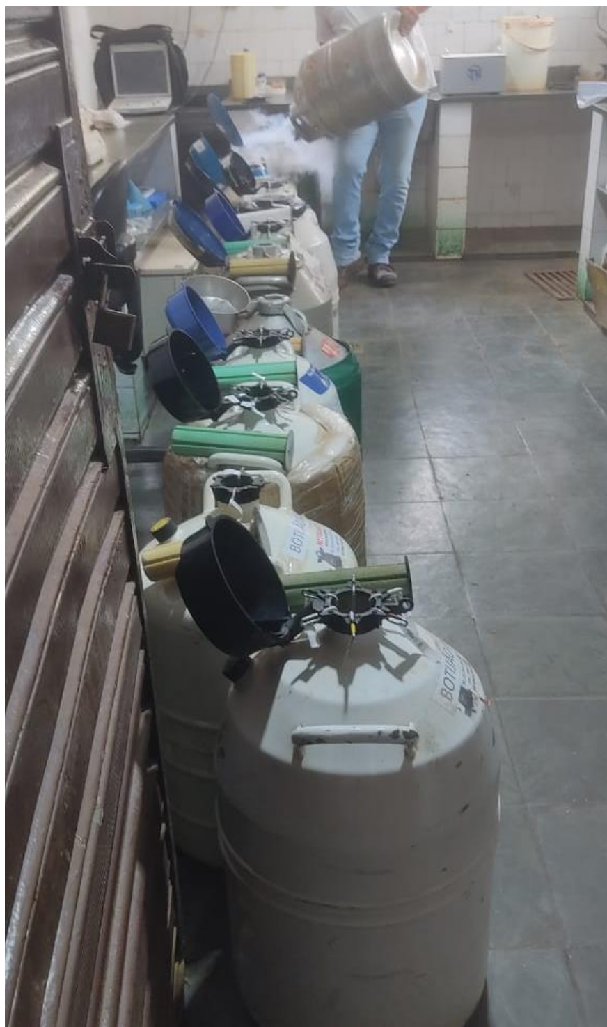
Figura 7- Criopreservação de sêmen em botijões de nitrogênio.