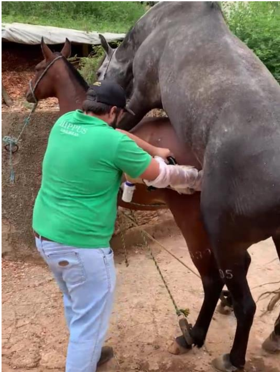
Figura 2- Coleta de sêmen de garanhão utilizando vagina artificial.