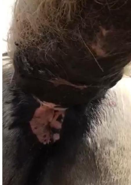
Figura 8: cicatrização da ferida cirúrgica após 90 dias de alta.