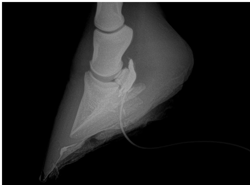
Figura 5: radiografia com contraste – evidenciando contato da bursa no navicular com a sola do casco do animal devido à acidente com perfurocortante.

Essa imagem faz relação com a disciplina de Cirurgia de Grandes Animais, que me permitiu obter conhecimentos de técnicas de incisão cirúrgica e planos de sutura; conhecimentos adquiridos nesta disciplina me ajudou a entender e poder auxiliar da melhor maneira o cirurgião.