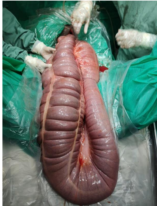
Figura 3: cirurgia de abdome agudo – exposição de cólon para drenagem do conteúdo compactado.