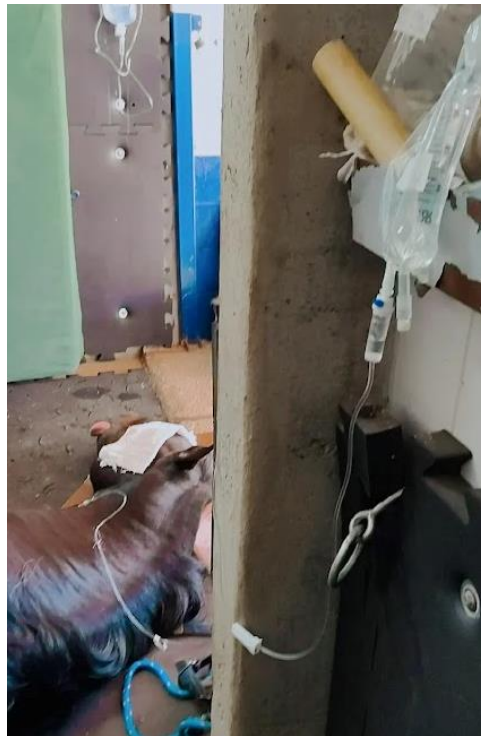
Figura 2: anestesia total intravenosa – Triple Drip.

Essa imagem tem relação com a disciplina de Clínica de Equídeos, onde pude aprender a importância de um primeiro atendimento bem feito, bem como os principais passos que devem ser realizados em um atendimento de síndrome cólica.