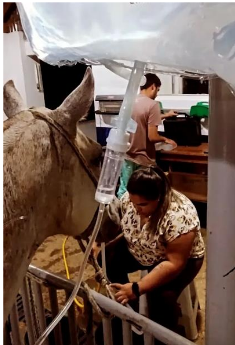
Figura 1: primeiro atendimento – síndrome cólica – procedimento de lavagem gástrica.

As imagens foram escolhidas de forma que fosse possível abordar o máximo de situações possíveis acompanhadas durante o estágio. São procedimentos de rotina e de pacientes diferentes, que servirão para ilustrar um pouco do que aprendi durante o tempo no hospital.