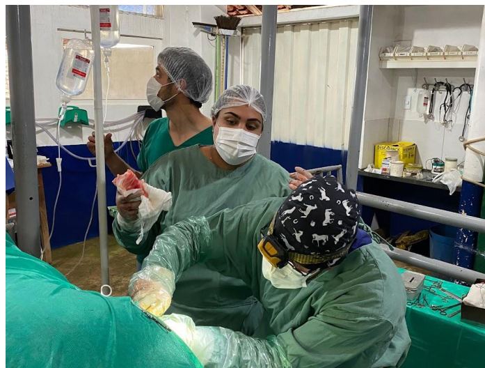
Figura 4: ovariectomia em posição quadrupedal – remoção de ovário com neoplasia.

Relaciono essa imagem com a disciplina de Anatomia Veterinária, que me permitiu conhecer as estruturas anatômicas e localizá-las, para conseguir realizar uma técnica cirúrgica adequada.