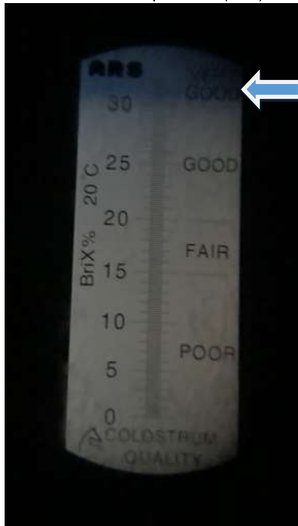
Figura 8: Refratômetro de BRIX usado para avaliar a qualidade do colostro indicando boa qualidade (seta).

Veterinário responsável intervêm com manobras obstétricas aprendidas na de Obstetrícia Veterinária.