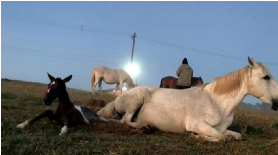
Figura 2: Neonato adotando o decúbito esternal.