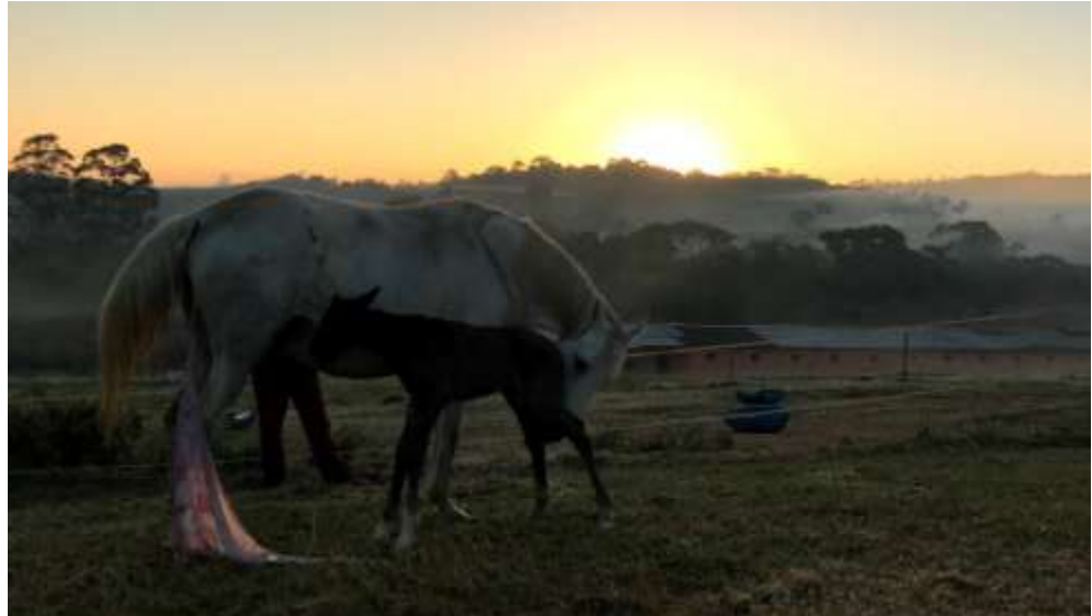
Figura 4: Neonato mamando o colostro.

maior que este. A foto está correlacionada com as disciplinas de Ginecologia e Obstetrícia Veterinária que fornece entendimentos dos processos que ocorrem com o recém-nascido e égua após o parto.