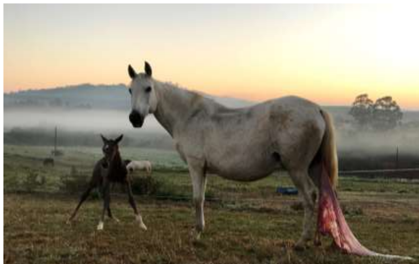
Figura 3: Potro ficando em posição quadrupedal após o nascimento.

A foto acima mostra o neonato adotando a posição de decúbito esternal, que deve acontecer em até 5 minutos após o nascimento. A imagem está correlacionada com a disciplina de Clínica de Equídeos em que foi aprendido sobre as mudanças fisiológicas que ocorrem nos neonatos e quais são os cuidados ideais de manejo que devem ser adotados para cuidar do neonato.