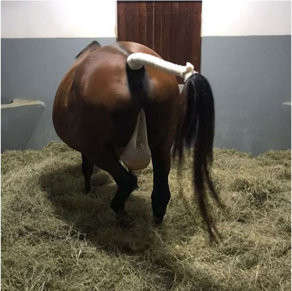
Figura 6: Protrusão da bolsa amniótica após a ruptura da membrana cório-alantoide.