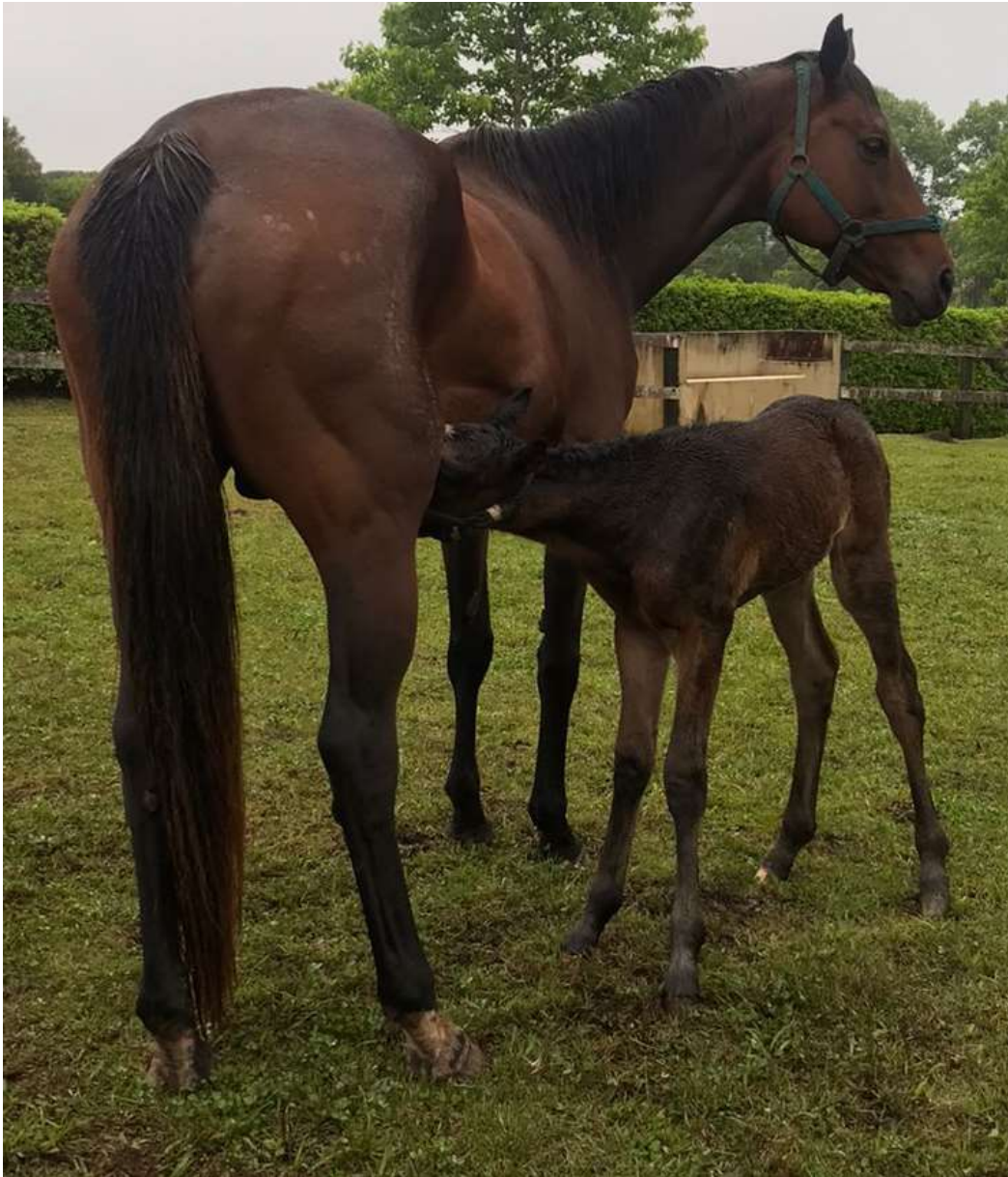
Figura 12: Neonato se amamentando em posição quadrupedal normal.