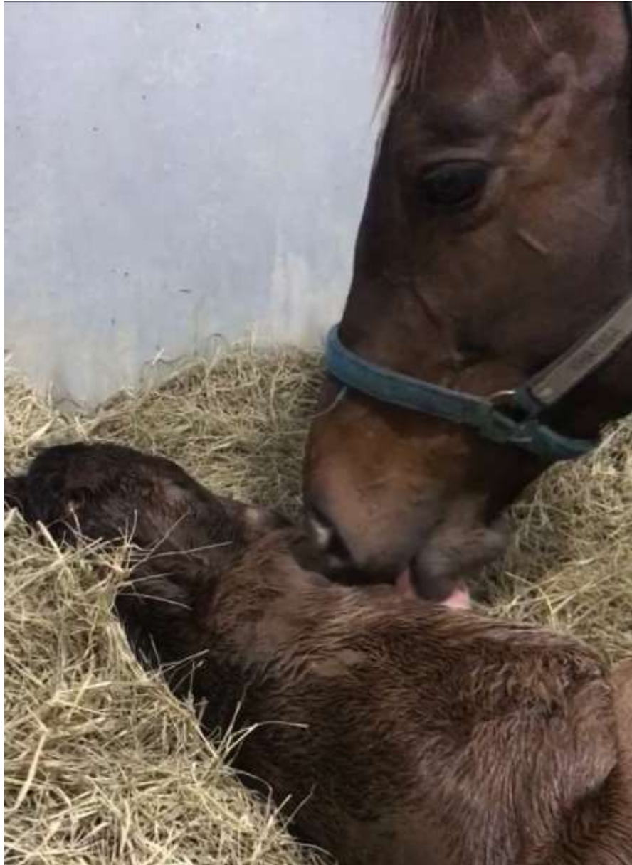
Figura 11: Estímulo materno com o neonato.

alimento na mãe, sendo assim, podemos correlacionar com a disciplina de Equinocultura, que aborda assuntos comportamentais da espécie.