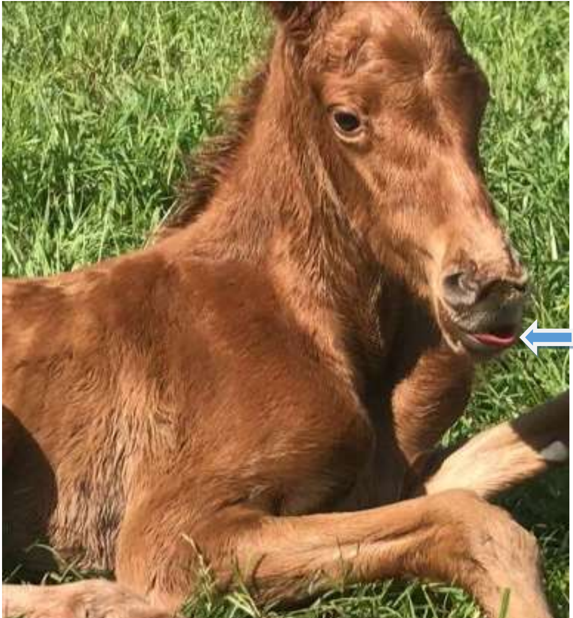
Figura 10: Neonato apresentando reflexo de sucção.

neonato, dessa forma a foto tem relação com a disciplina de Obstetrícia Veterinária, onde são abordados assuntos relacionados a análise da placenta no pós-parto.