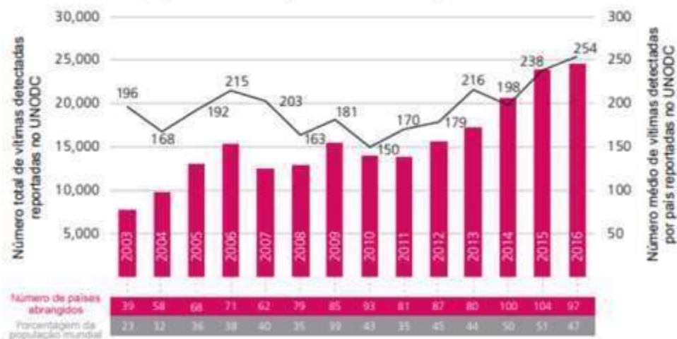
Tendências no número total de vítimas de tráfico detectadas e reportadas ao UNODC, número médio de vítimas detectadas por país e número de países declarantes, por ano, 2003-2016

Fonte: elaboração de dados nacionais pelo UNODC.