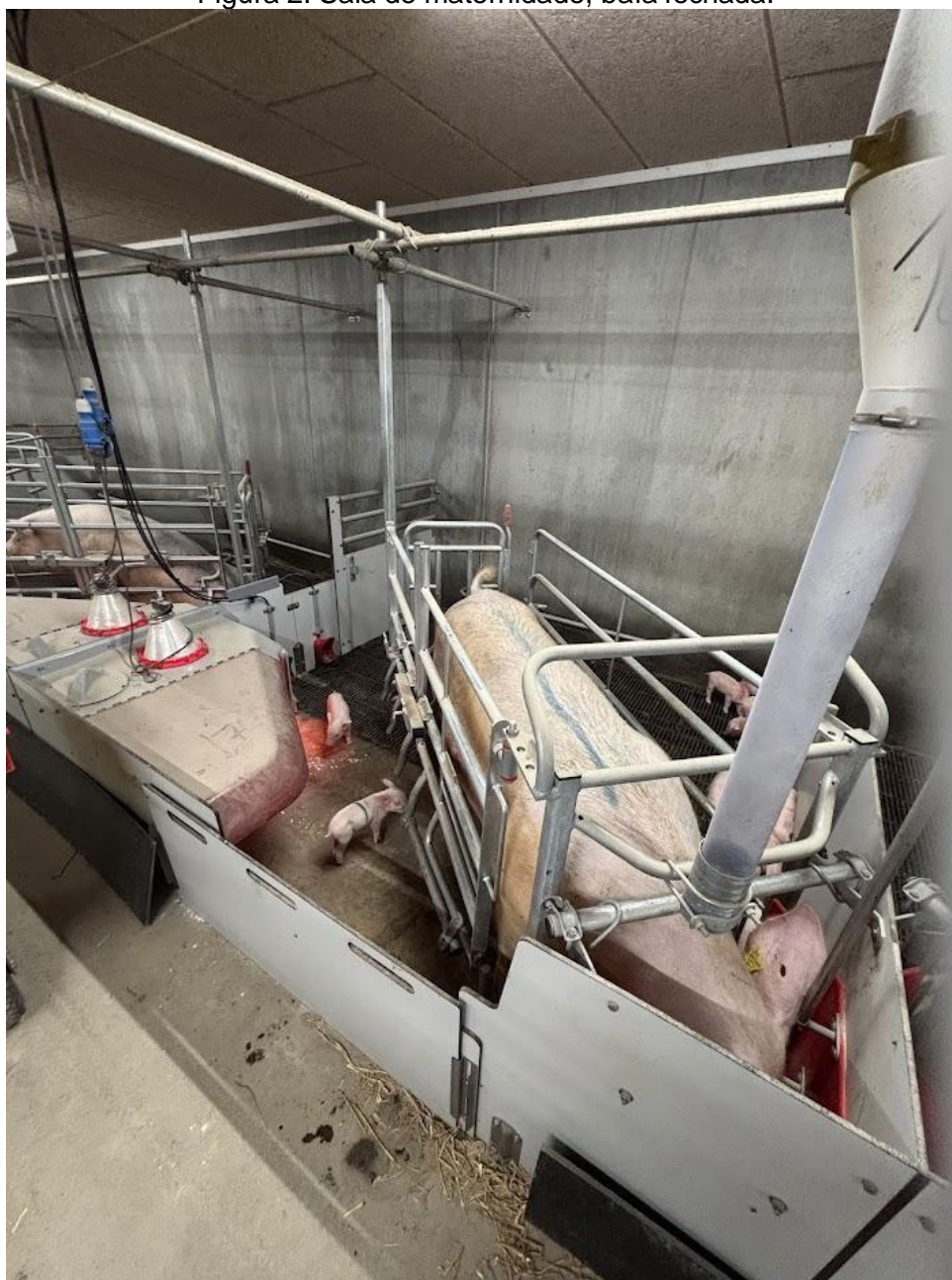
Figura 2: Sala de maternidade, baía fechada.