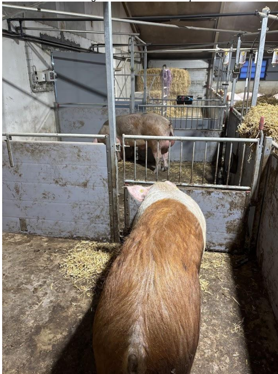
Figura 11: Baía dos cachaços

animais até atingirem aproximadamente 25 kg, quando são comercializados para granjas de terminação.