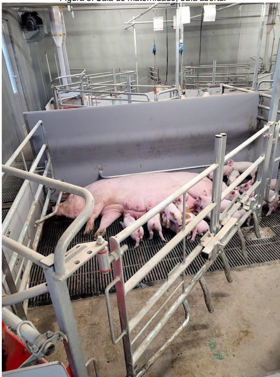
Figura 3: Sala de maternidade, baía aberta.