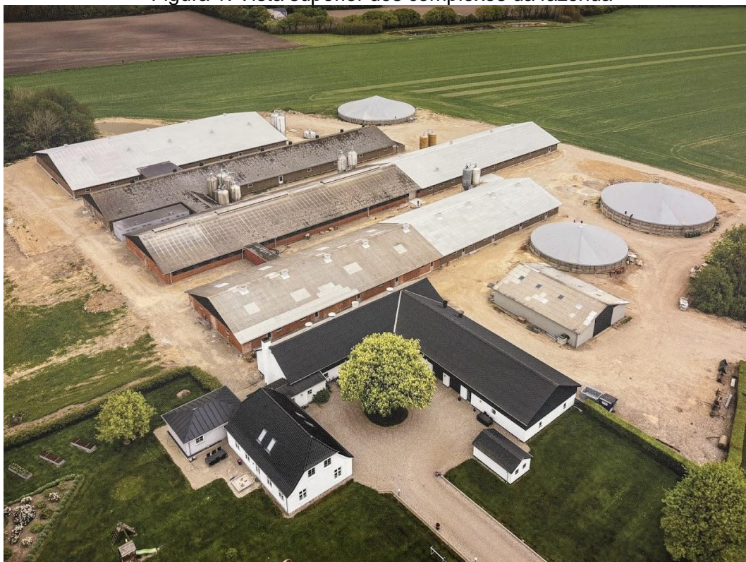
Figura 1: Vista superior dos complexos da fazenda

As imagens a seguir demonstram parte das atividades realizadas durante o período de estágio.