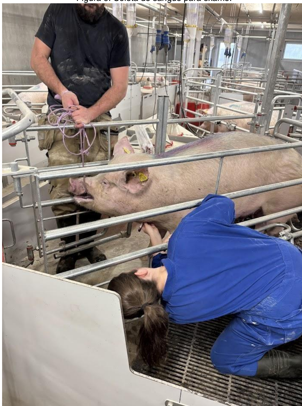
Figura 6: Coleta de sangue para exame.