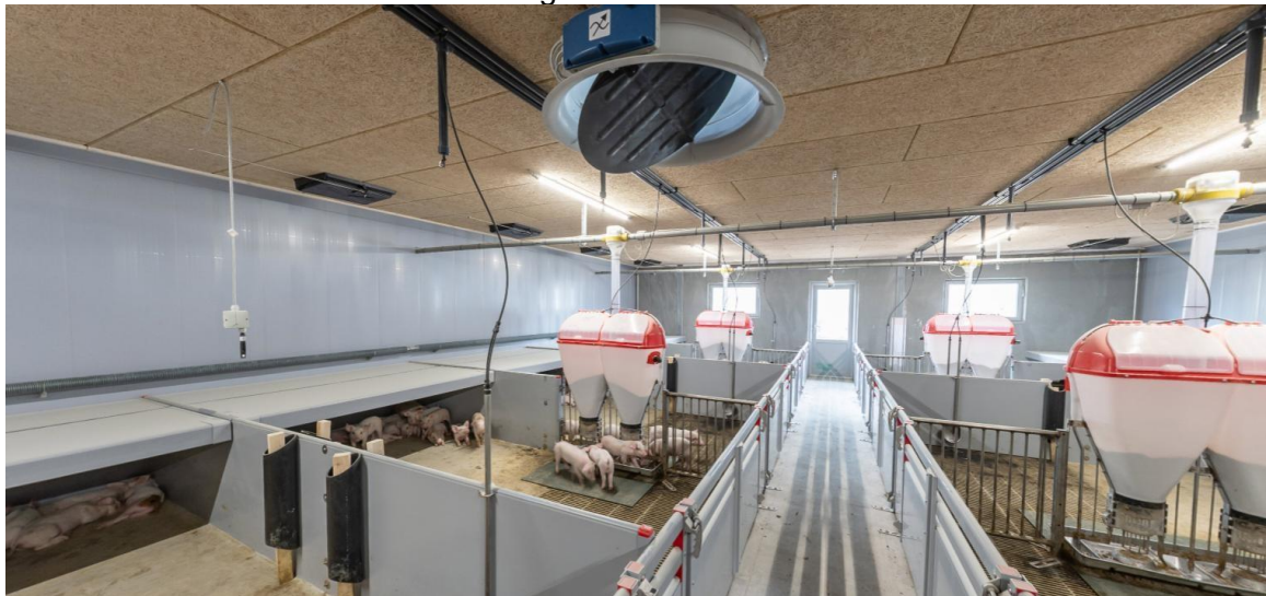
Figura 10: Creche

A Figura 9 ilustra o galpão de inseminação, composto por nove fileiras horizontais, cada uma contendo 24 boxes individuais, equipados com comedouros e bebedouros próprios. O manejo diário nesse setor segue protocolos padronizados, para garantir a eficiência reprodutiva e o conforto das matrizes. O sêmen para inseminação é mantido fresco na geladeira e a cada 3 dias é recebido um pacote com o sêmen novo da empresa Danbred.