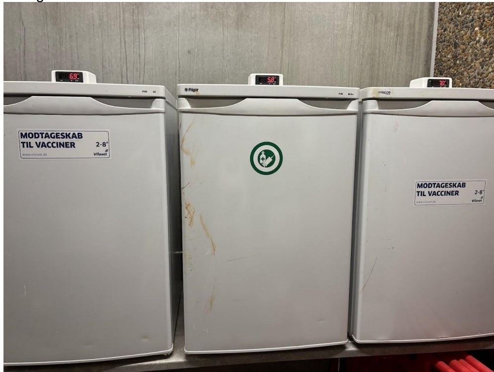
Figura 12 Geladeiras de armazenamento de medicamentos e vacinas.