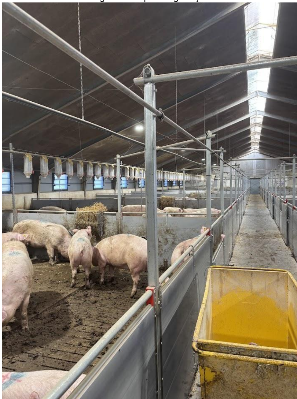
Figura 4: Galpão de gestação