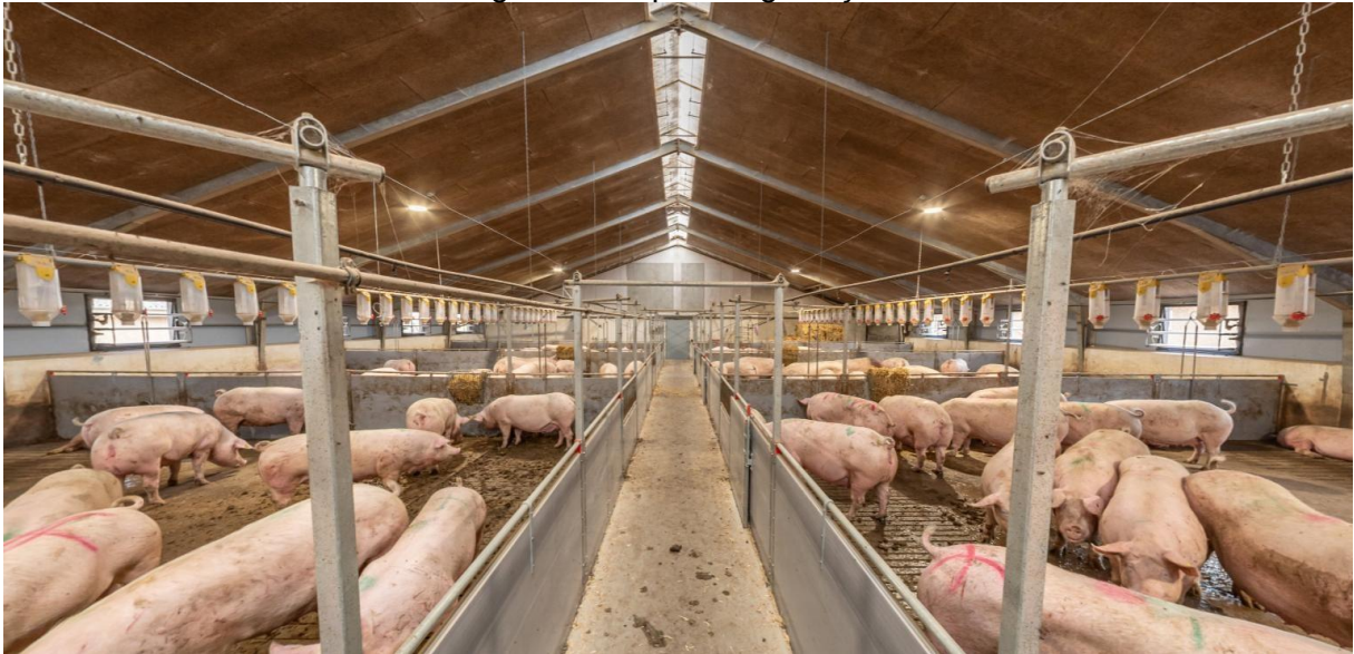
Figura 5: Galpão de gestação