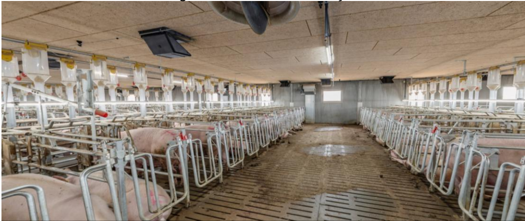
Figura 9: Sala de inseminação