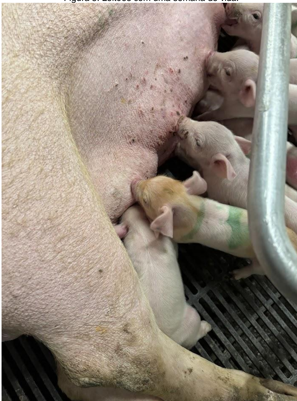
Figura 8: Leitões com uma semana de vida.