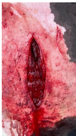
Imagem 12: Sutura de músculo oblíquo abdominal externo, oblíquo abdominal interno, transverso do abdome e peritônio.

Na etapa final da cirurgia, as camadas musculares e o peritônio são suturados conjuntamente, aplicando pontos simples separados com o mesmo fio de Catgut cromado 4 estéril e agulha curva (Imagem 12). Os pontos são duplamente fixados, assegurando maior segurança e estabilidade.