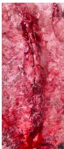
Imagem 14: Sutura de pele.

O último passo envolvia a sutura da pele, um procedimento crucial para assegurar a integridade da incisão. Neste processo, é utilizado um fio de Nylon com espessura de 0,60 mm, acoplado a uma agulha de 40x12 18G. A técnica escolhida para a sutura foi o padrão de ponto contínuo festonado (Imagem 14).