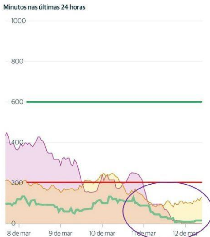
Imagem 1: Taxa de ruminação e ingestão nos últimos 5 dias, demonstrando uma queda na taxa de ruminação e ingestão de alimentos.