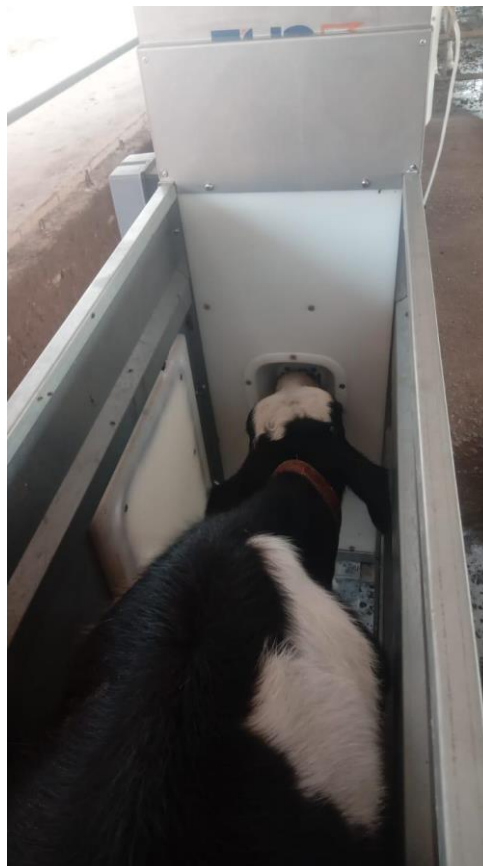
Imagem 7: Amamentador automático para bezerras em fase de teste.

Durante o estágio, os proprietários da fazenda realizaram uma pesquisa detalhada, visitando outras propriedades que utilizam amamentadores automáticos (Imagem 7) para avaliar a eficácia e os benefícios desse sistema. Após consultarem diferentes fornecedores e realizarem orçamentos com várias empresas, optaram por testar um modelo fornecido por uma delas. O equipamento havia sido instalado na fazenda e estava em fase de testes, permitindo uma avaliação prática do seu desempenho e impacto na eficiência do manejo e na alimentação das bezerras.