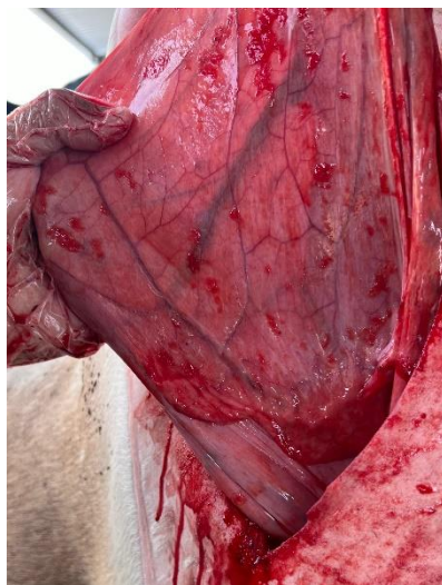
Imagem 11: Fração do omento maior.

Com o abomaso devidamente esvaziado, para que retornasse à sua posição anatômica, foram realizadas manobras manuais. O omento maior (Imagem 11) é suturado à parede abdominal direita, o que o mantém no lugar. Essa fixação é realizada com dois pontos simples separados, utilizando fio Catgut cromado 4 e agulha curva, com o objetivo de prevenir recidiva.