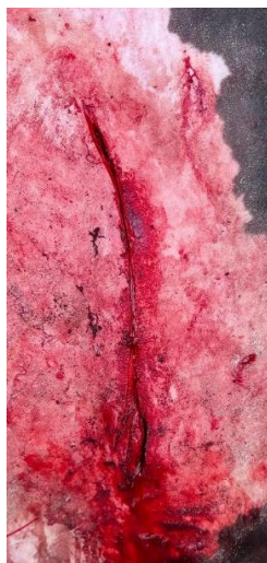
Imagem 13: Sutura Subcutânea para redução do espaço de tecido morto, com aproximação das bordas.

Para minimizar o espaço de tecido morto entre a sutura das camadas musculares e a sutura da pele, foi feita a aplicação de uma sutura subcutânea contínua, reduzindo significativamente o risco de acúmulo de fluidos no espaço entre as camadas (Imagem 13).