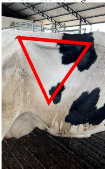
Imagem 4: Flanco direito onde foi realizado a cirurgia.