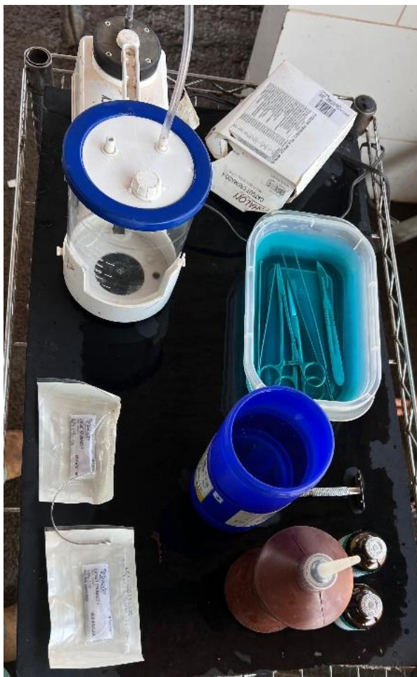
Imagem 3: Materiais que foram utilizados na cirurgia.