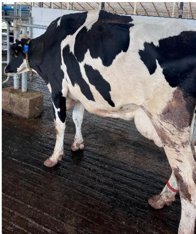
Imagem 2: Paciente com ECC baixo suspeita de DAE.