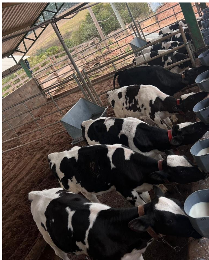
Imagem 6: Sistema de compostagem para bezerras (Bezerreira 2).

Ao atingirem o peso de desmame de 120kg, elas eram levadas para outra instalação conhecida como Bezerreira 2 (Imagem 6), onde continuam se amamentando e tendo todo controle sanitário.