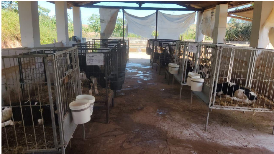
Imagem 5: Bezerras alojadas em gaiolas individuais (Bezerreira 1).

A fazenda dispunha de um bezerreiro, onde as bezerras eram alojadas em gaiolas individuais na fase inicial de crescimento, até atingirem aproximadamente 100 kg de peso vivo. Essa estrutura era conhecida como Bezerreira 1 (Imagem 5). Durante esse período crucial de desenvolvimento, cada bezerra recebia cerca de 8 litros de leite por dia, garantindo uma nutrição adequada para fortalecer o sistema imunológico e promover um crescimento saudável.