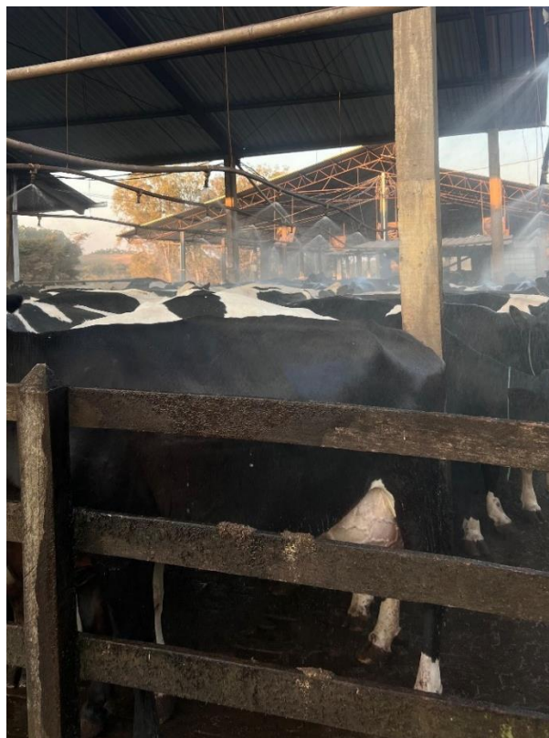
Imagem 3: Sala de espera com resfriamento através de bicos aspersores.

Antes do início do processo de ordenha, os animais são direcionados para a sala de espera (Imagem 3), onde passam por um sistema de resfriamento. Nesse espaço, as vacas recebem uma aspersão controlada de água combinada com ventilação forçada, com o objetivo de reduzir a temperatura corporal de forma eficiente. Esse procedimento é fundamental para minimizar o estresse térmico, um fator que pode afetar diretamente a produção leiteira e o bem-estar das vacas. O resfriamento adequado contribui não apenas para melhorar o conforto dos animais em climas mais quentes, mas também para otimizar o desempenho na ordenha, já que vacas em condições de estresse térmico tendem a produzir menos leite e podem apresentar sinais de desconforto.