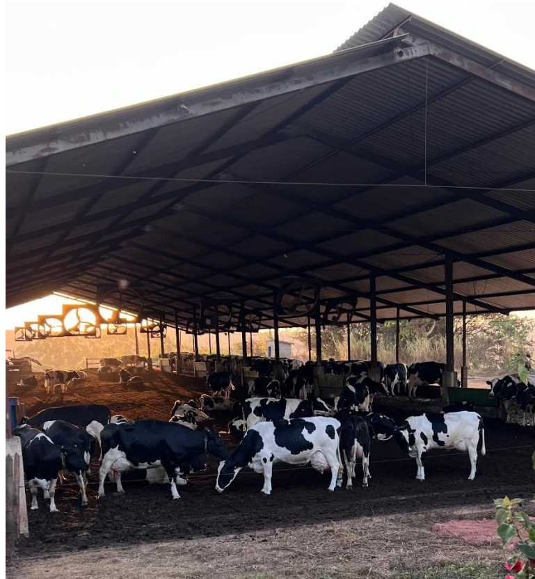
Imagem 1: Confinamento com sistema Compost Barn .

A propriedade conta com dois galpões com um sistema de confinamento de Compost Barn (Imagem 1), que proporcionam conforto e bem-estar às vacas leiteiras.