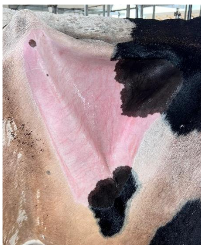
Imagem 5: Área da região cirúrgica onde foi feito a tricotomia.

Após a conclusão da higienização, o próximo passo envolve a realização da tricotomia da região (Imagem 5). Esse processo visa remover os pelos ao redor da área onde será feita a incisão. A tricotomia delimita com precisão a área de trabalho, melhorando a visibilidade e higiene da região cirúrgica. Logo após a tricotomia, realiza-se uma nova e rigorosa antissepsia da área com 2L de solução abundante de água potável e desinfetante à base de Cloreto de Alquil Dimetil Benzil Amônio , com a intenção da remoção significativa de impurezas e resíduos e reforçando a barreira contra potenciais contaminações.