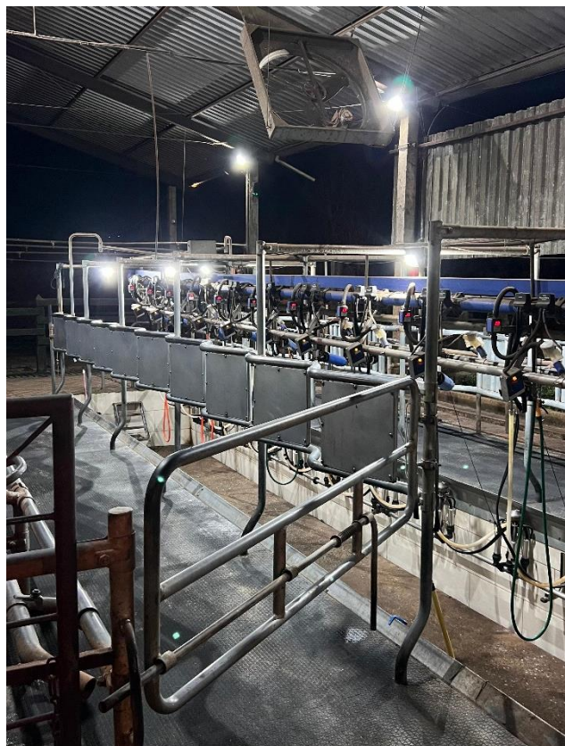
Imagem 2: Sala de ordenha com fosso e sistema 2x10, linha alta.