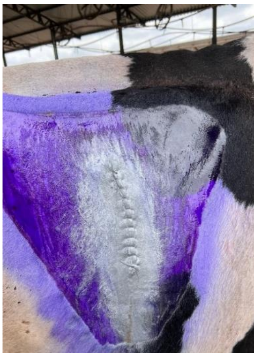
Imagem 15: Área cirúrgica limpa e com spray repelente.

Após a conclusão da cirurgia, a área ao redor da incisão foi cuidadosamente lavada com água limpa e um desinfetante apropriado, evitando que nenhum líquido entre em contato com o local recém-suturado. Em seguida, foi aplicado um spray aerossol, que atua como repelente, cicatrizante e antisséptico (Imagem 15).