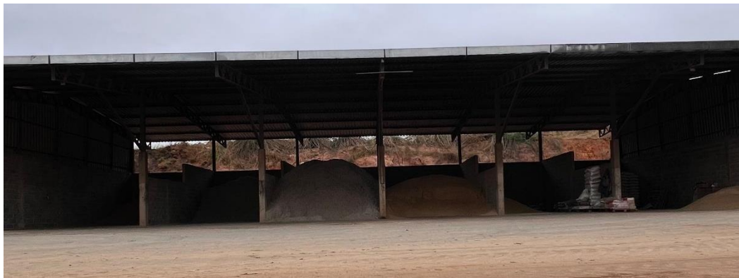
Figura 4: “Cozinha”, local de armazenamento de dos insumos.

Além dessas áreas, a fazenda possuía um outro galpão onde era a “cozinha” (Imagem 4), onde eram armazenados todos os ingredientes da dieta, exceto as forragens utilizados na alimentação dos animais.