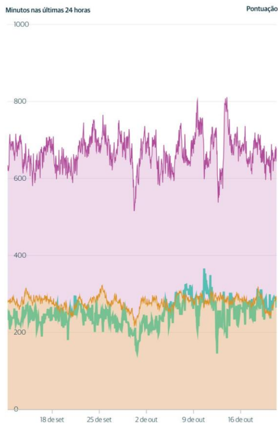
Imagem 16: Gráfico de ruminação e ingestão alimentar após 6-7 meses de pós-operatório.