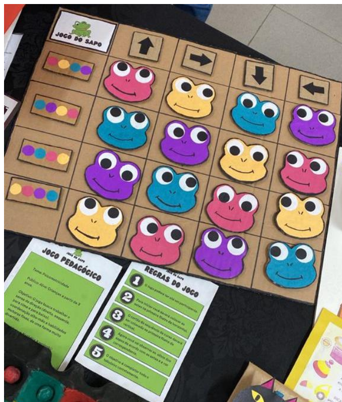
Figura11 - O jogo do sapo

Para Nathália foi possível englobar diversos destes aspectos mencionados na criação da sua atividade. Seu recurso foi um jogo pedagógico intitulado “O jogo do sapo” (Figura 11), o objetivo é trabalhar a noção espacial (esquerda, direita, para cima, para baixo), além de desenvolver a coordenação motora fina de uma forma divertida e usando a assimilação de cores. Segundo Magill (2011), a coordenação motora fina é um componente específico da coordenação motora geral, sendo definida como a habilidade do indivíduo para manipular objetos com as mãos e explorar cada vez mais os elementos presentes em seu entorno.