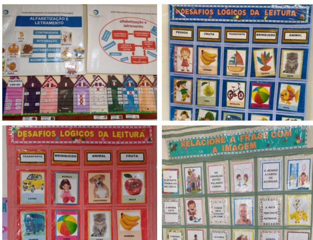
Figura16 - Recursos Pedagógicos

intervenções de Magda Soares, nos fez perceber o quanto o trabalho em equipe de forma cooperativa faz toda a diferença nos resultados finais, vimos que são escolas de altos níveis de educação pública e, para além disso, com afetividade e empatia presentes. Nos beneficiamos de fotografar e registrar todos os recursos pedagógicos criados pelas próprias professoras e ainda foi possível observar as crianças usando tais recursos (Figura 16), de maneira familiar, demonstrando que aquilo que víamos era fato o que era sempre feito ali, não apenas demonstrações do acervo, mas materiais de uso rotineiro para eles.