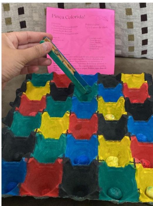
Figura12 - Pinça colorida

Nesse contexto, as atividades de Priscilla e Tatiane podem tanto ser usadas por crianças quanto para pessoas adultas que precisam de estímulos na coordenação motora fina, Tatiane construiu um recurso feito com pente de ovo e pregadores, “Pinça Colorida” (Figura 12), que possui o objetivo de desenvolver também a concentração por meio do movimento de pinça ao pegar bolinhas de algodão coloridas e parear com suas respectivas cores. Ela ficou apreensiva se conseguiria obter os materiais com excelência e se as crianças iriam gostar do resultado. Eu, utilizei um papel firme (Paraná) para fazer furos que seriam utilizados como alinhavo, intitulada “Caixa de Alinhavos” (Figura 13), trabalhando também a coordenação motora fina por meio do manuseio do barbante pelos furos, utilizei de formas e um desenho de tênis, promovendo habilidades como costura e amarração.