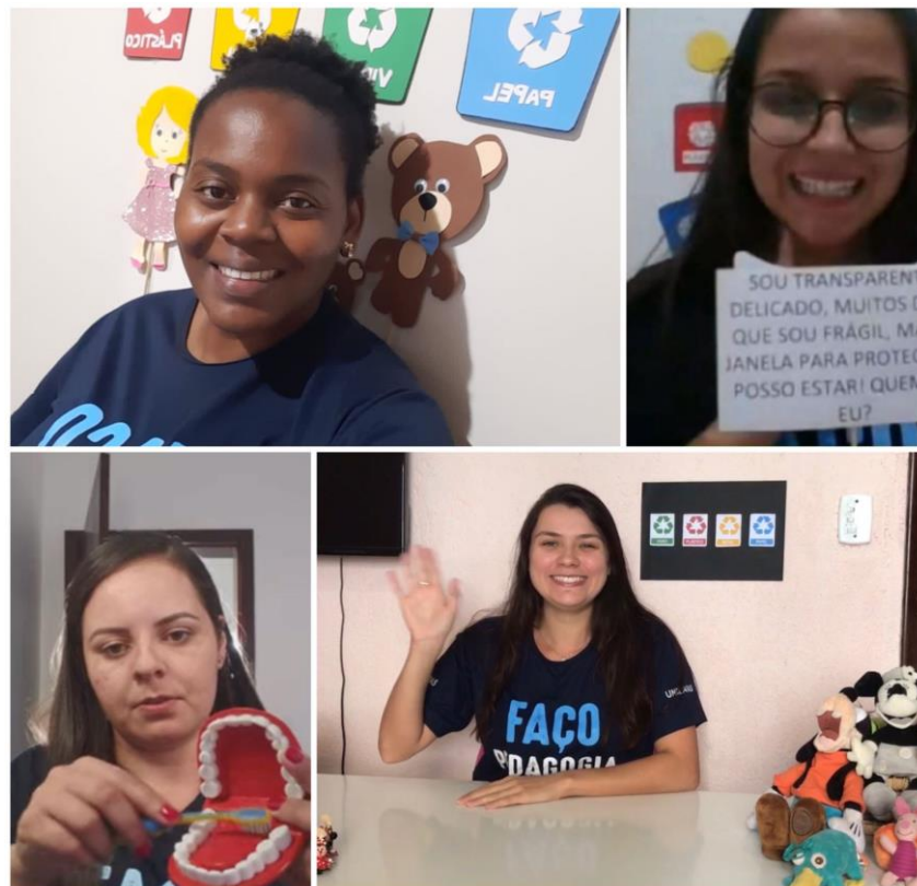
Figura 01 – Aula remota

O objetivo central para a realização da atividade era apresentarmos uma aula remota planejada por nós, estudantes, para alunos(as) dos anos Iniciais do Ensino Fundamental, construindo uma metodologia mais dinâmica, seguindo orientações norteadas pela Base Nacional Comum Curricular (BNCC). Vale ressaltar que a aula (Figura 01) seria uma simulação como se estivéssemos no papel de professores regentes e os colegas fossem nossos alunos.