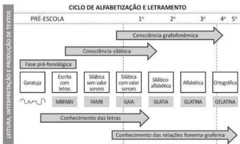
Figura15 - Quadro ciclo de alfabetização e letramento

transição com a próxima fase, sendo está a alfabética que a criança compreende que cada som corresponde a uma letra, mas ainda mantém trocas na hora de escrever, principalmente sons parecidos. A última fase é a ortográfica, a criança já compreende que cada som representa uma letra, sendo capaz de escrever as palavras corretamente. Segue abaixo quadro da página 137 do livro Alfaetrar.