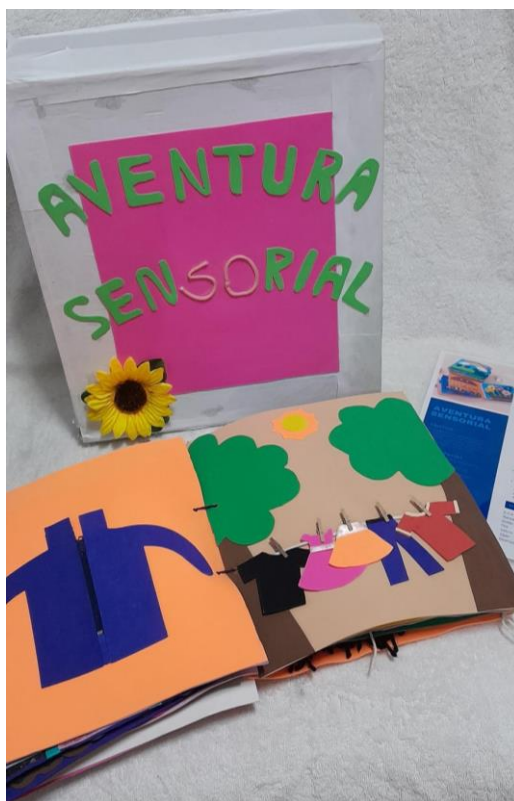
Figura14 - Aventura sensorial