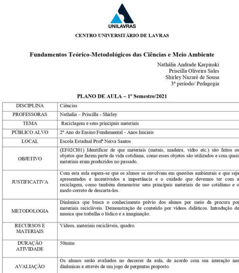
Figura 02 - Plano de aula

da importância do plano de aula (Figura 02), visto que a metodologia elaborada foi cumprida durante a execução da atividade proposta.