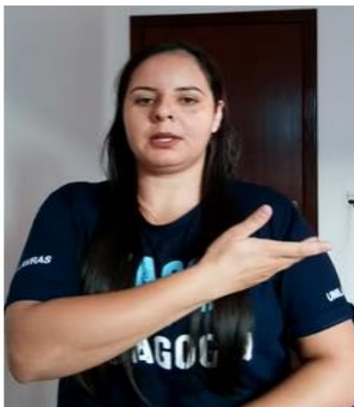
Figura 08 - Vídeo Tatiane - "A Amizade, Mundo Bitá"

Segue abaixo o link para acesso aos vídeos e foto ilustrativa da produção.