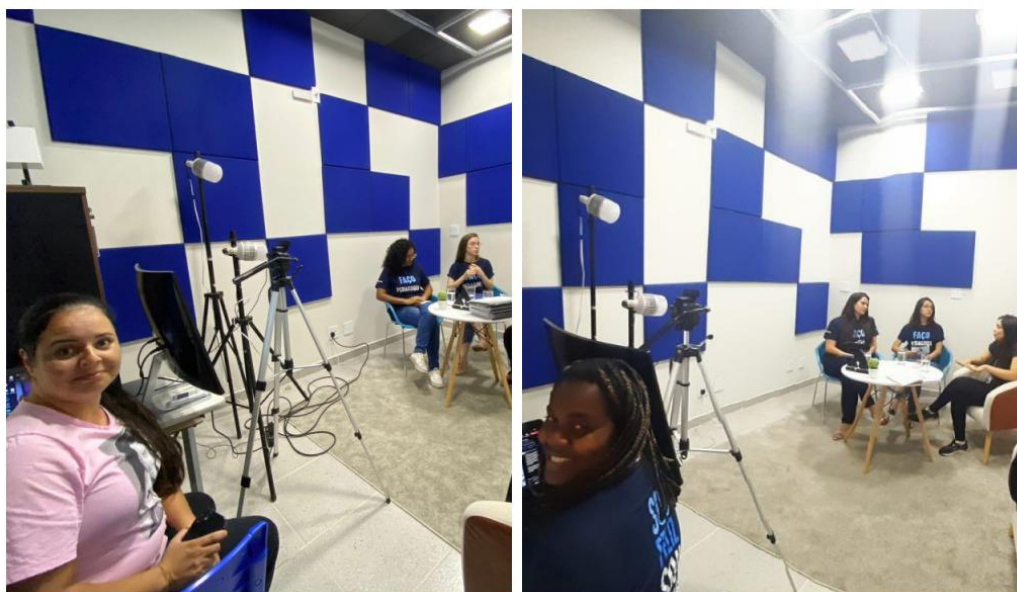
Figura 18 - Bastidores Podcast