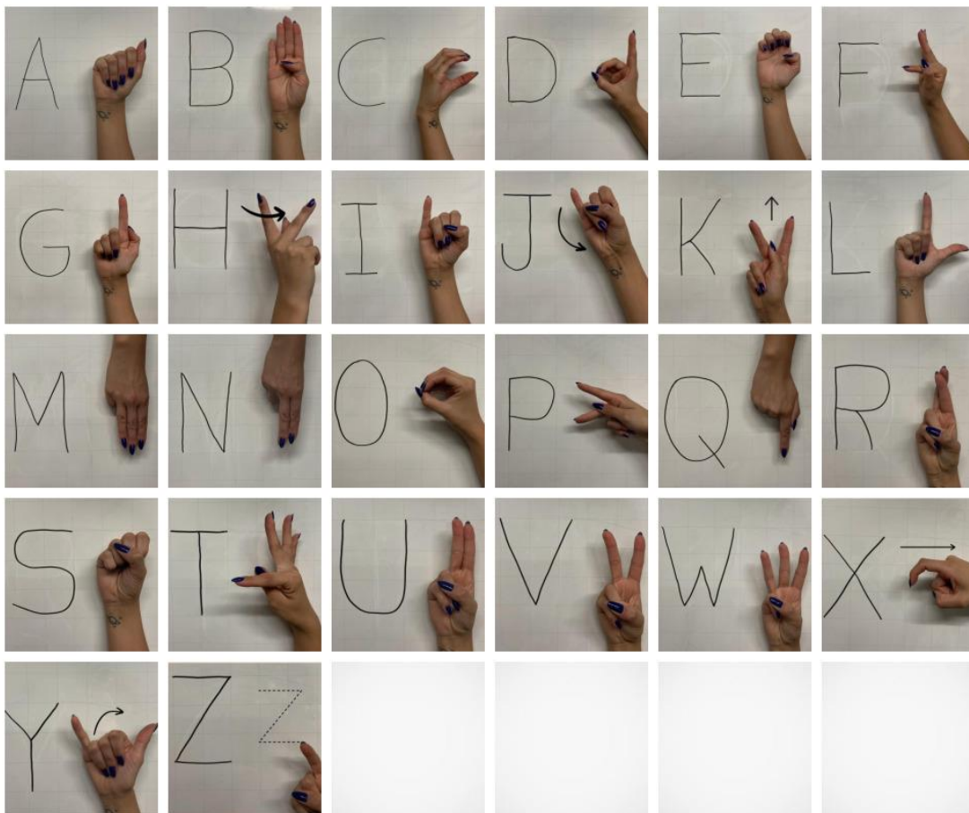
Figura10 - Alfabeto Libras

na Língua Brasileira de Sinais, porque sem esse parâmetro não seria possível a existência de uma língua na modalidade visual gestual” (ANDRADE; LIMA;BORGES, 2021). Este parâmetro torna-se primordial para uma comunicação efetiva na comunidade surda e no convívio social de modo geral, oportunizando a integração das pessoas com deficiência auditiva em todos os meios sociais. Construímos um alfabeto representando a Libras, segue abaixo.