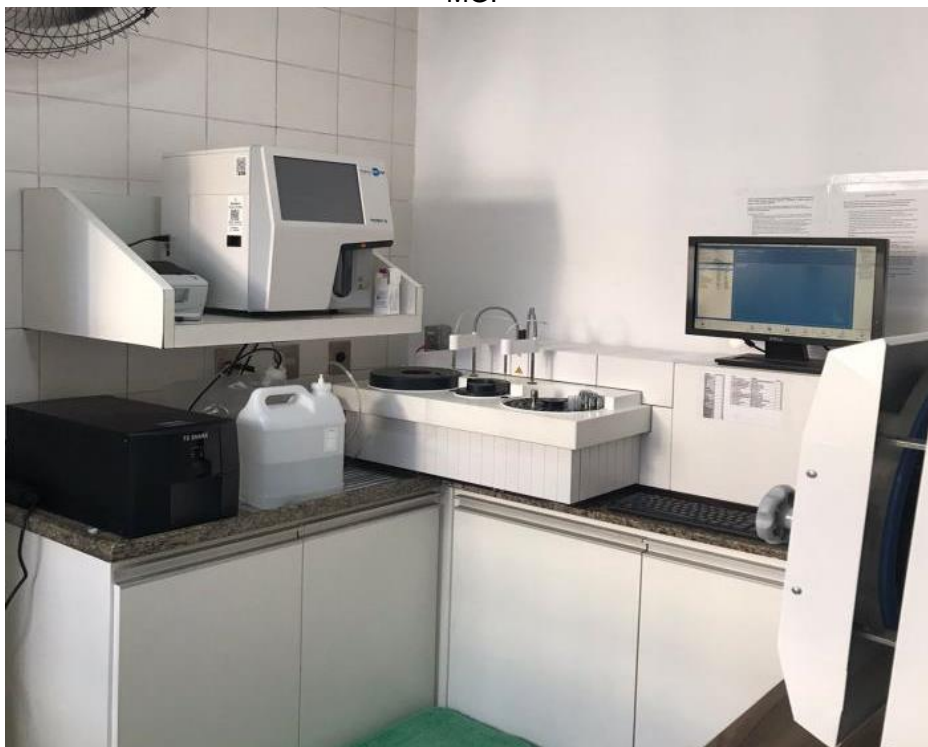
Figura 5- Vista parcial da sala de esterilização e análises laboratoriais da clínica veterinária. Lavras-MG.