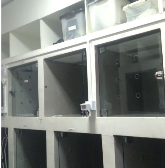
Figura 2- Vista parcial da internação de cães da clínica veterinária. Lavras-MG

baías cada; uma pia para higienização; e freezer para guardar medicações e alimentos dos animais (Figura 2).