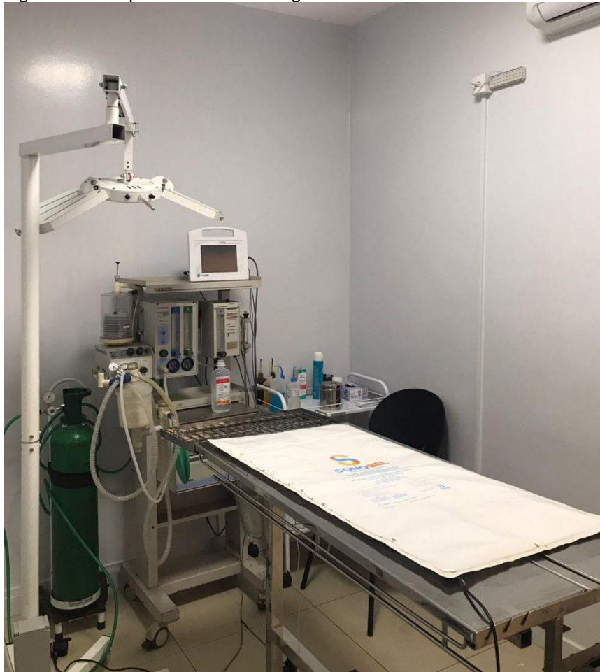
Figura 3- Vista parcial da sala cirúrgica da clínica veterinária. Lavras-MG.

segundo contém um computador e a reveladora digital. Ao lado, há a sala de tomografia, contendo a mesa de exame, tomógrafo e equipamentos de segurança (Figura 4). Neste mesmo lado há uma sala para exame ultrassonográfico, contendo calhas, gel, uma mesa de inox e o aparelho de ultrassom.