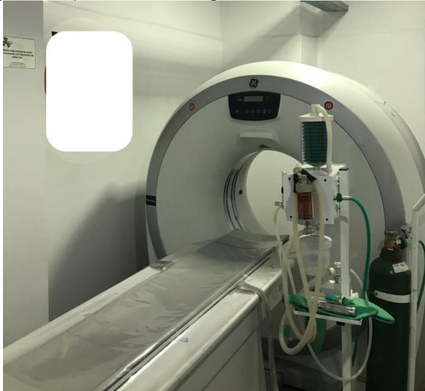
Figura 4- Vista parcial da sala de tomografia da clínica veterinária. Lavras-MG.