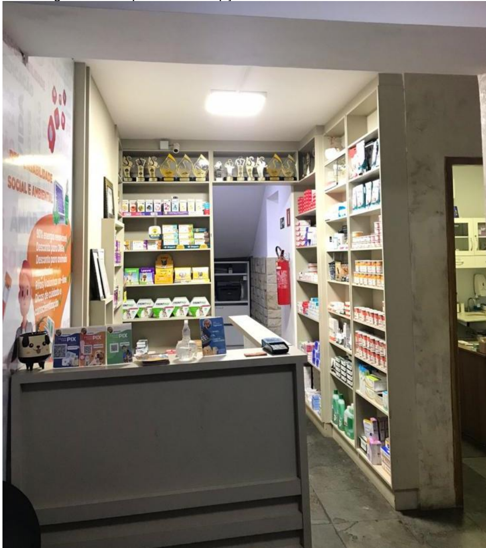
Figura 1- Vista parcial da recepção da clínica veterinária. Lavras-MG.