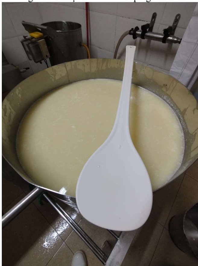
Imagem 1: Adição de coalho e pingo no leite.

Em sequência para a produção do QMACFN, é indispensável a adição da cultura láctica natural e do coalho, que devem estar registrados no Serviço de Inspeção Estadual (SIE) ou no Serviço de Inspeção Federal (SIF), além do pingo, que precisa ser cuidadosamente captado e armazenado para uso posterior (IMA, 2024). O pingo é o soro que, durante o processo de salga, se desprende da massa de queijo. Ele escorre e é recolhido em um recipiente próprio, sendo cuidadosamente armazenado para uso na produção do dia seguinte (FURTADO, 1980).