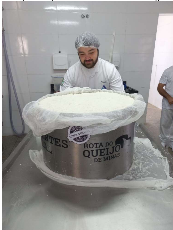
Imagem 1: Produção do Super Queijo Minas Artesanal da microrregião Campo das Vertentes.

As imagens a seguir (Imagens 1 a 5) demonstram parte das atividades realizadas durante o período de estágio.