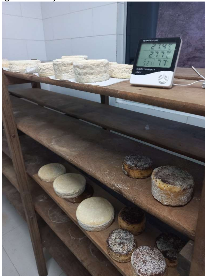
Imagem 5: Queijos com 20 dias na câmara de maturação.