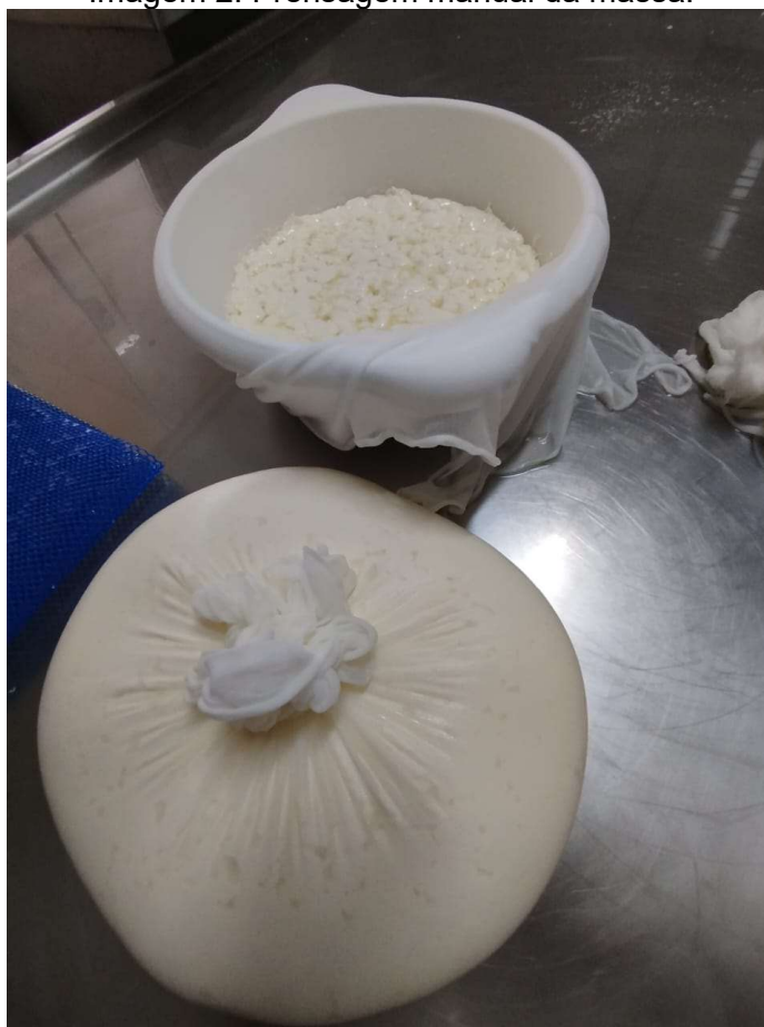
Imagem 2: Prensagem manual da massa.

Na dessoragem, aproximadamente 70% do soro é retirado do tanque de coagulação, removendo o excesso para a captação da massa para a enformagem (LAGUNA, 2018). O processo de enformar e prensar a massa é essencial, ocorre quando a massa é colocada em formas específicas, de fácil higienização, para que o queijo ganhe a forma característica de queijo e também evitar possíveis olhaduras mecânicas. A quantidade de massa varia de acordo com o tipo de queijo produzido (IMA, 2024).