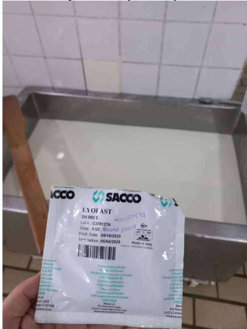
Imagem 2: Produção de muçarela.