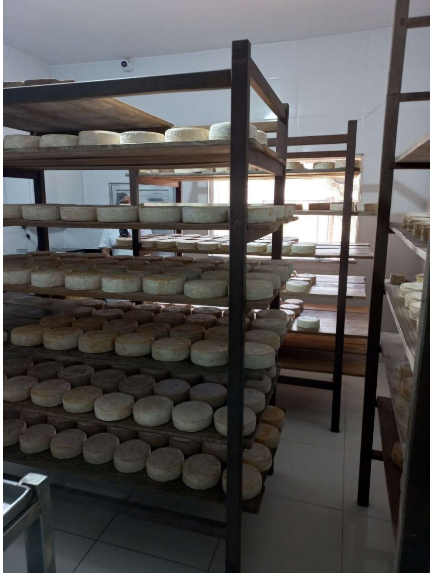
Imagem 4: Câmara de maturação de queijo minas artesanal de casca florida natural.