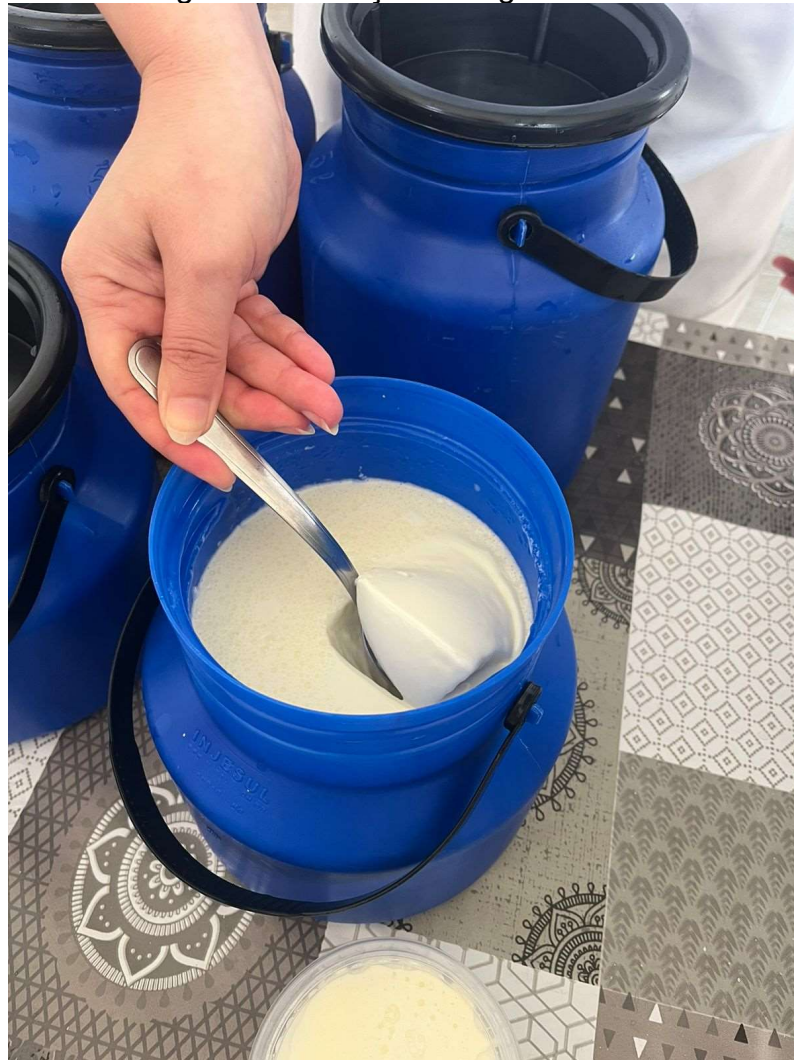
Imagem 2: Produção de iogurte natural.