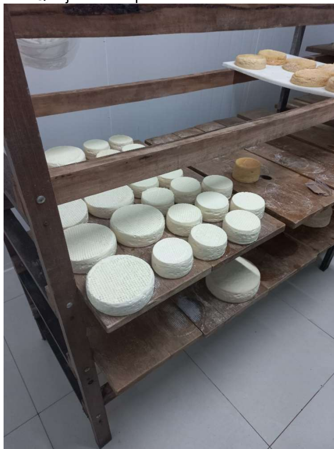
Imagem 4: Queijos recém produzidos na câmara de maturação.