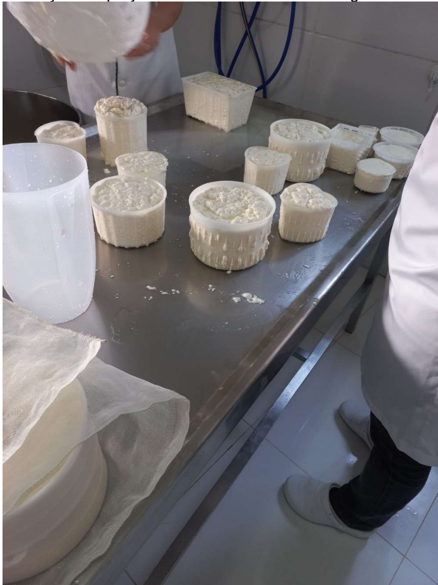
Imagem 3: Produção de queijo minas artesanal da microrregião Serra da Canastra.