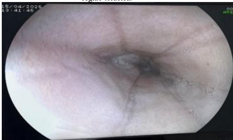
Figura 10: Imagem endoscópica da mucosa esofágica com erosões focais na região torácica.