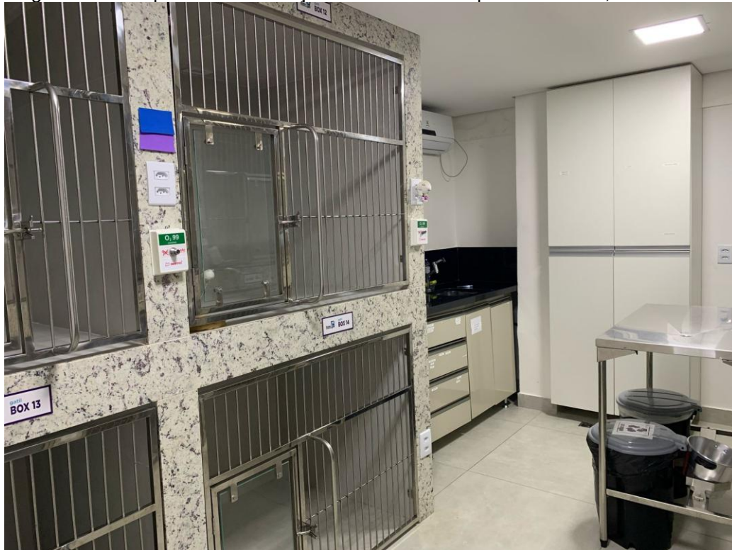
Figura 6 – Vista parcial da internação de felinos do hospital veterinário, Belo Horizonte - MG.