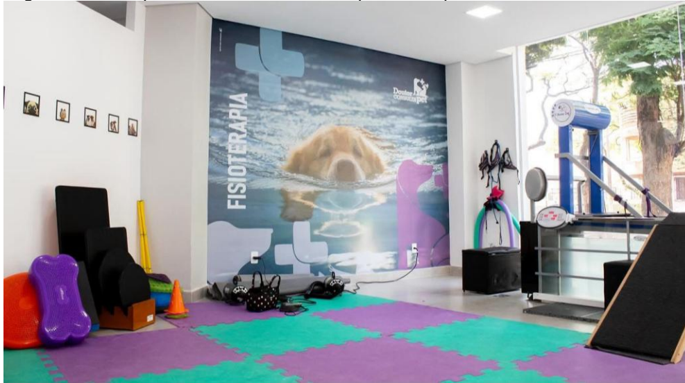
Figura 4 – Vista parcial da sala de fisioterapia do hospital veterinário, Belo Horizonte - MG.