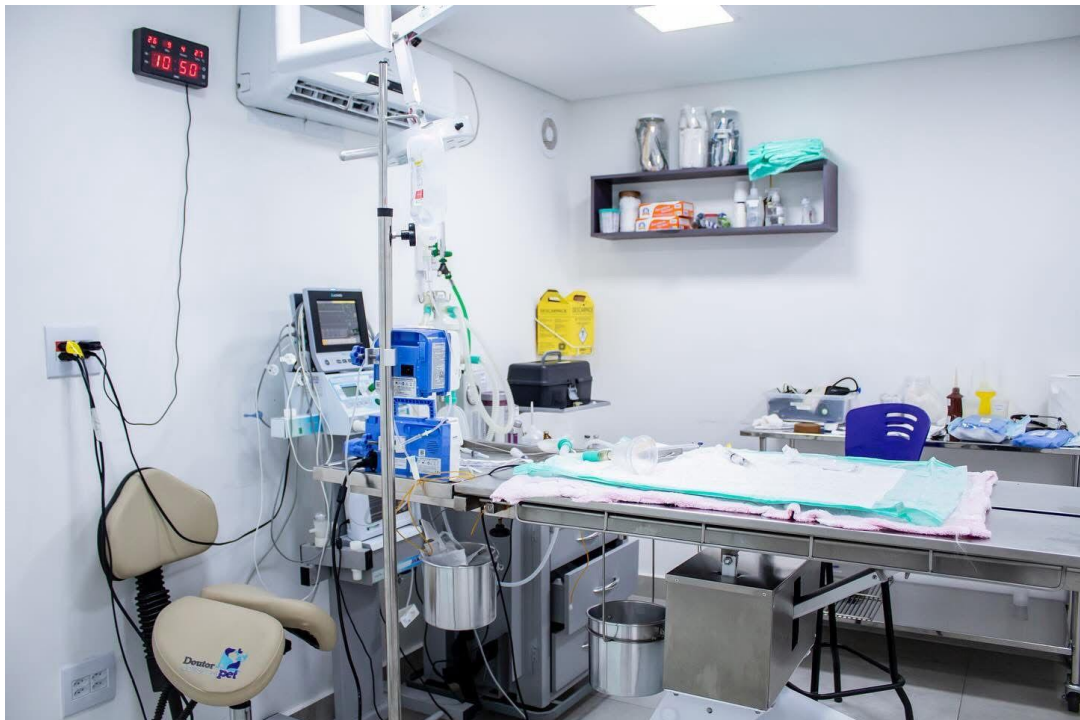
Figura 7 – Vista parcial do bloco cirúrgico do hospital veterinário, Belo Horizonte – MG.