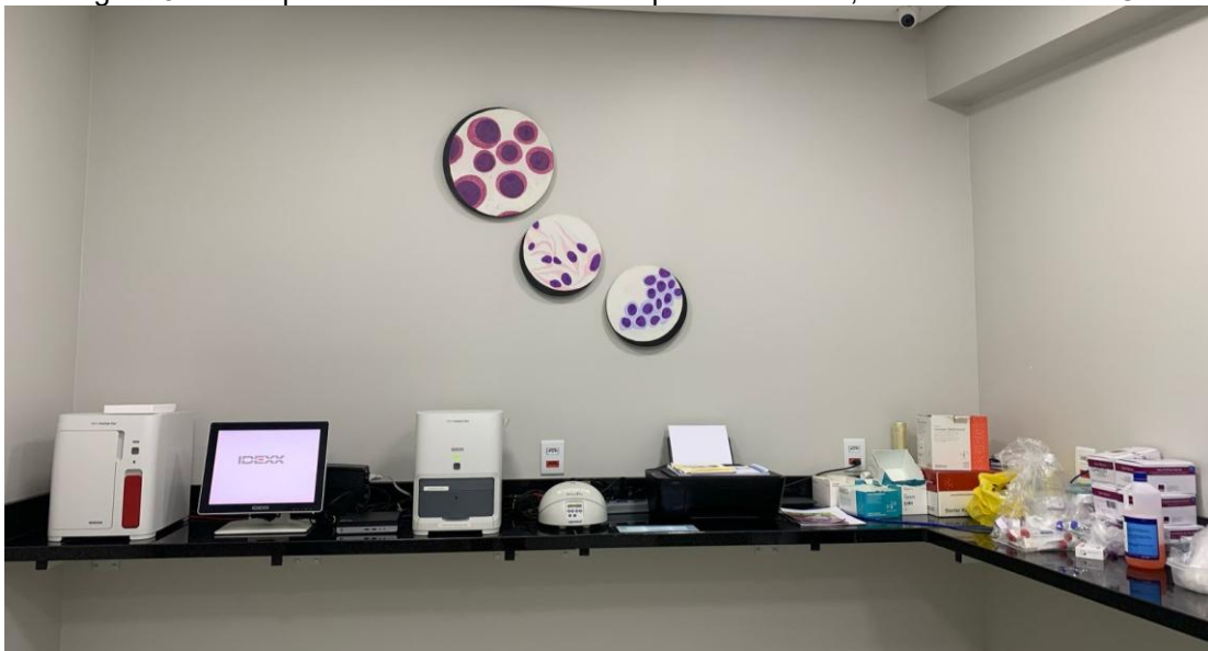
Figura 3 – Vista parcial do laboratório do hospital veterinário, Belo Horizonte – MG.

Já o laboratório (Figura 3) possui aparelhos de exames hematológicos, como hemograma e bioquímico, microscópio, testes rápidos para diversas doenças, impressora, kit de Panótico ® , lâminas, luvas, tubos de coleta, uma geladeira pequena para armazenar amostras biológicas e uma mesa de madeira com cadeira.