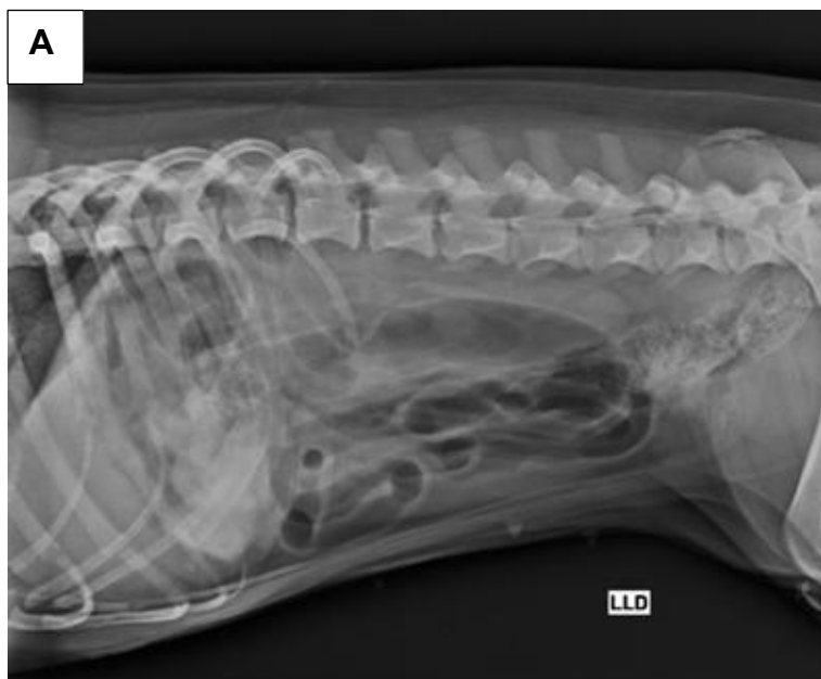
Figura 8: Radiografias abdominais do cão com corpo estranho gástrico. Observa-se duas estruturas amorfas e radiopacas no estômago, na região do antro (seta vermelha). A: incidência laterolateral direita. B: incidência ventrodorsal.