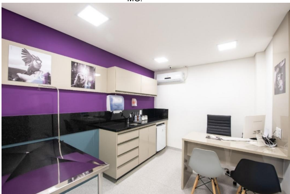
Figura 2 – Vista parcial de um dos consultórios de cães do hospital veterinário, Belo Horizonte - MG.

Os consultórios de ambas as espécies (Figura 2) são equipados com um balcão com pia para a higienização das mãos, materiais hospitalares, uma mesa de aço inoxidável, uma mesa de madeira com computador, armários para armazenar materiais de atendimento, como focinheiras, luvas e termômetro, uma cadeira para o veterinário e duas destinadas aos responsáveis.