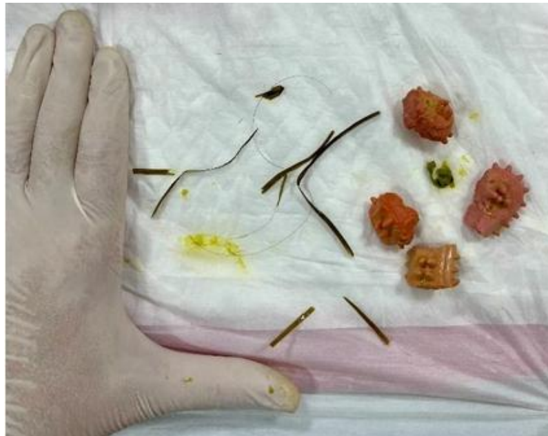
Figura 12: Corpos estranhos removidos do estômago do cão por meio de endoscopia, sendo quatro pedaços de brinquedo de plástico e algumas folhas de grama.