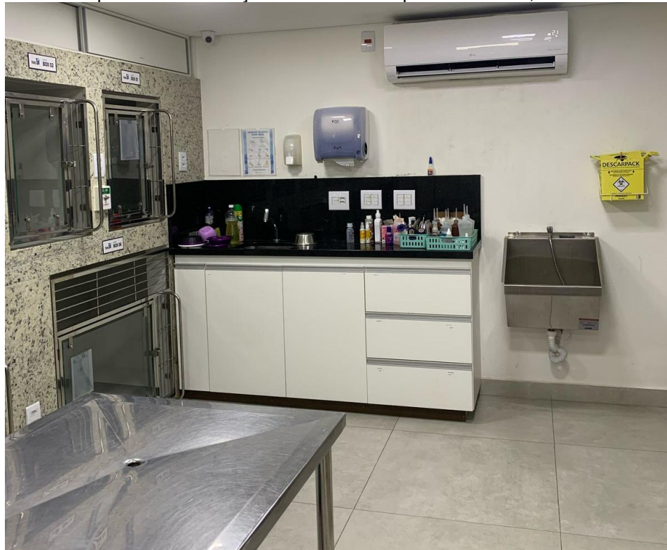
Figura 5 – Vista parcial da internação de cães do hospital veterinário, Belo Horizonte - MG.