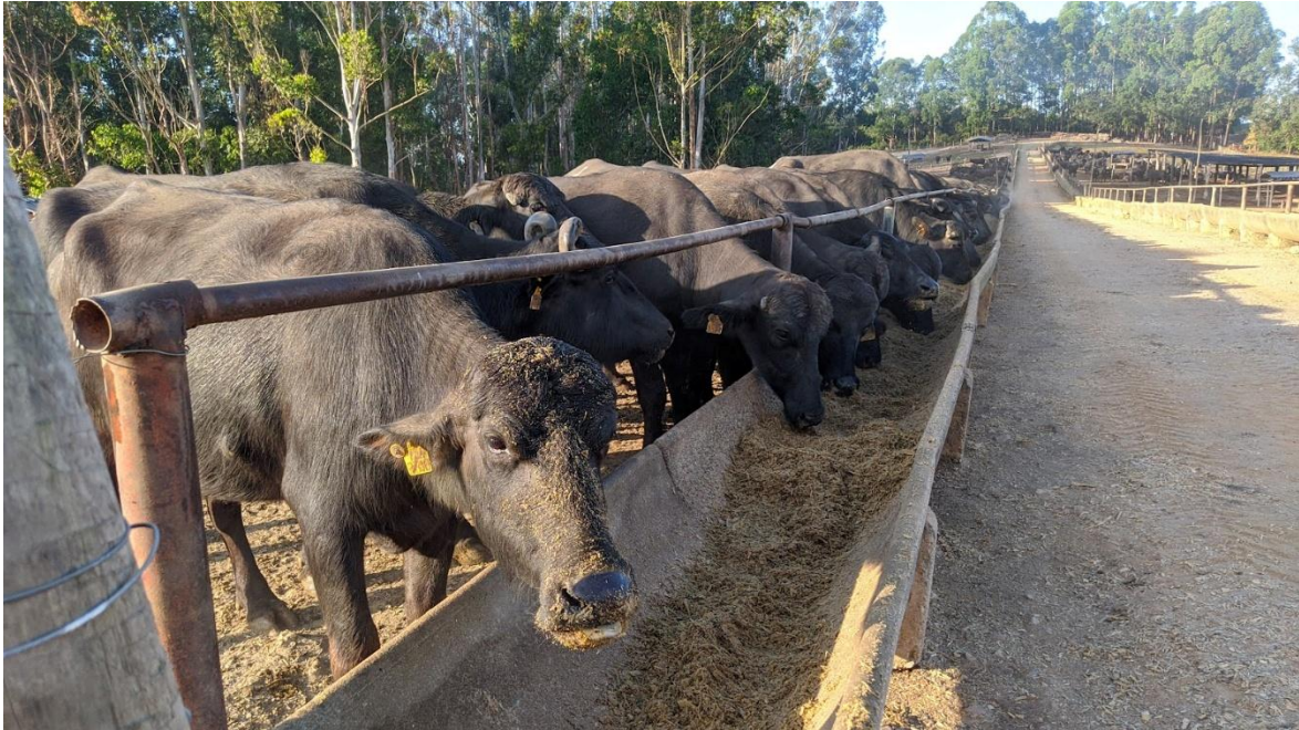
Figura 2: Curral de suplementação – local onde as búfalas em lactação recebem diariamente alimentação, composta por silagem de milho, capineira, milho moído, soja, cevada, soro e suplementação mineral.