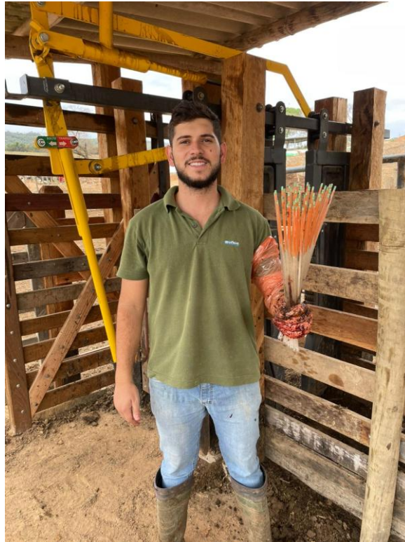
Figura 7: Material utilizado no manejo reprodutivo de búfalas leiteiras.