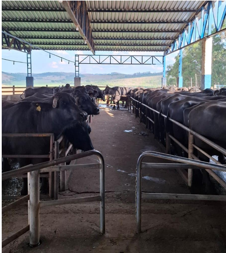
Figura 3: Sala de espera coberta da ordenha.