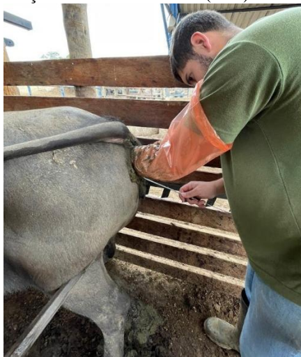
Figura 1: Inseminação artificial no Dia 12 (D12) na fase lunar lua nova.

As informações referentes às fases da lua e suas respectivas prevalências foram obtidas junto ao Instituto Nacional de Meteorologia (INMET), órgão oficial responsável pelo monitoramento e registro de fenômenos astronômicos e meteorológicos no Brasil. Os dados foram consultados por meio do calendário lunar disponibilizado pelo INMET, que indica a data e o horário exato em que cada fase atinge 100% de prevalência (lua nova, crescente,