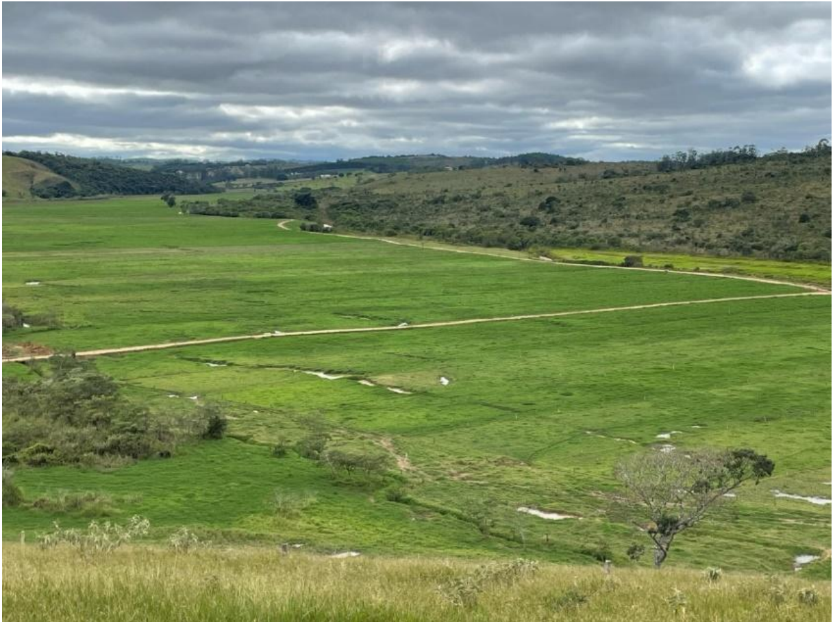
Figura 1: Área pastejo - dividida em piquetes estratégicos, sendo exclusivamente destinado às búfalas em lactação no período das águas.