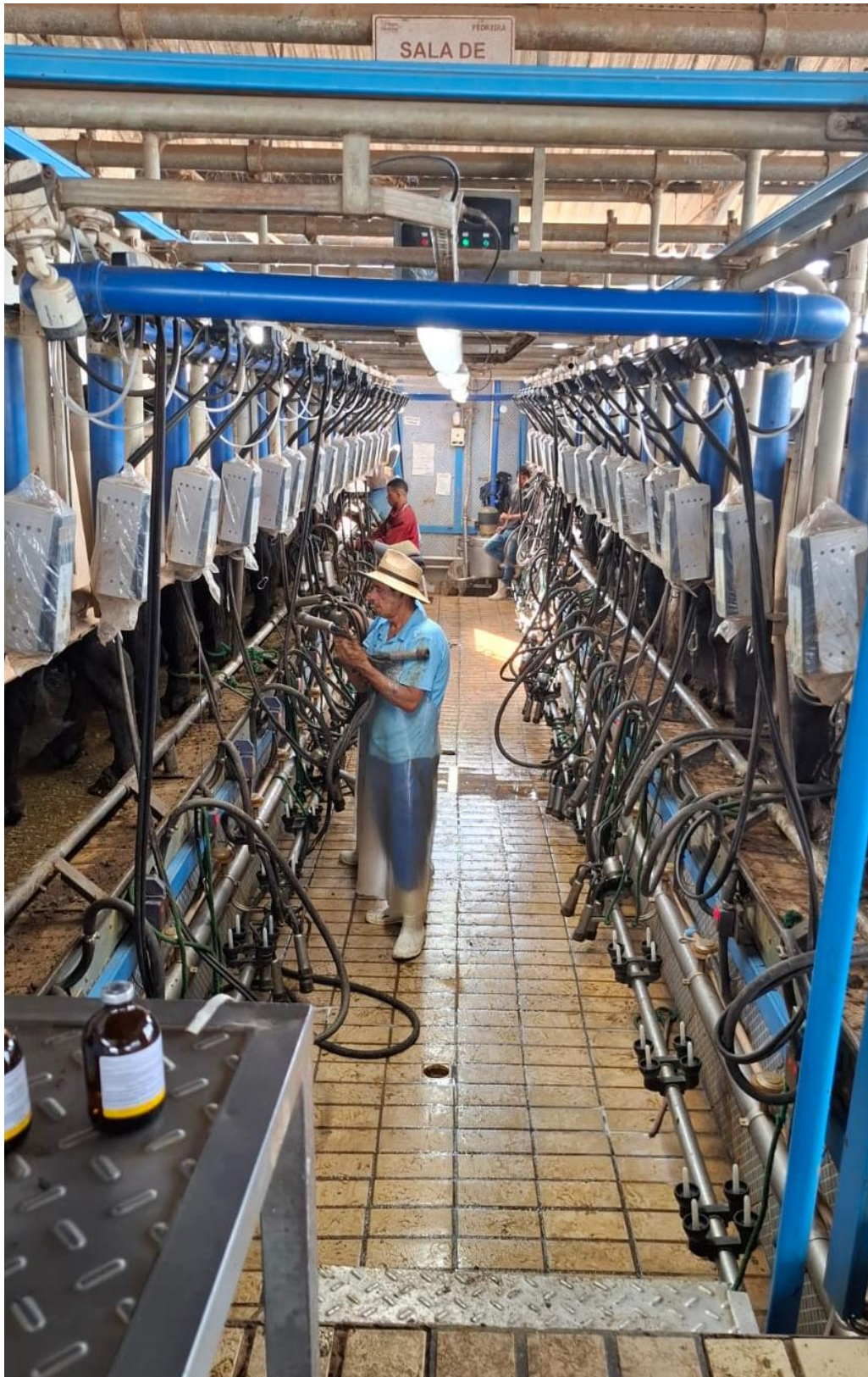
Figura 4: Ordenha automatizada canalizada no estilo espinha de peixe, com capacidade para 32 búfalas simultaneamente, sendo 16 de cada lado.