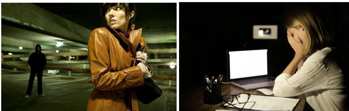
Figura 1. Crime de perseguição – Formas de Stalking