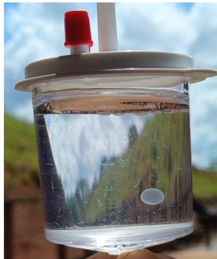
Figura 4 – Embrião após a lavagem

Na Figura 4 é possível observar um embrião após a realização da lavagem do útero.