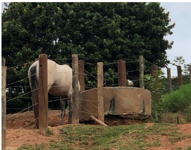
Figura 1 – Cocho de água compartilhado entre animais de diferentes lotes.

Os primeiros sinais clínicos observados foram febre, descarga nasal mucopurulenta e ruídos respiratórios como roncos e sibilos. Em seguida, muitos animais desenvolveram linfadenite submandibulares e retrofaríngeos, com evolução para formação de abscessos, dos quais alguns drenaram espontaneamente, conforme podemos observar nas Figuras 2 e 3, respectivamente.