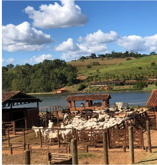
Figura 3 – Curral principal