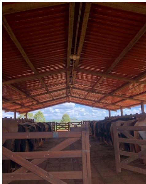
Figura 2 – Lanchonete

Na Figura 2, é possível observar onde são realizados os procedimentos com as éguas, local conhecido como “lanchonete”. Além disso, evidenciam-se as éguas em bretes individuais, para a realização de exames ultrassonográficos, transferências de embrião, entre outros.