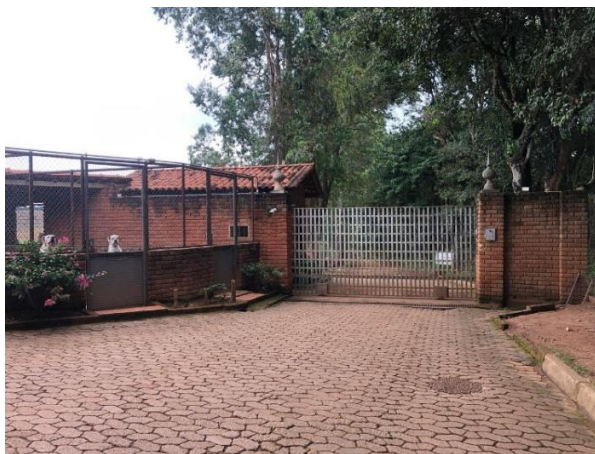
Figura 1 – Portaria principal da fazenda

A seguir, são apresentadas imagens que ilustram as informações descritas. Na Figura 1 é possível ver a portaria principal da fazenda.