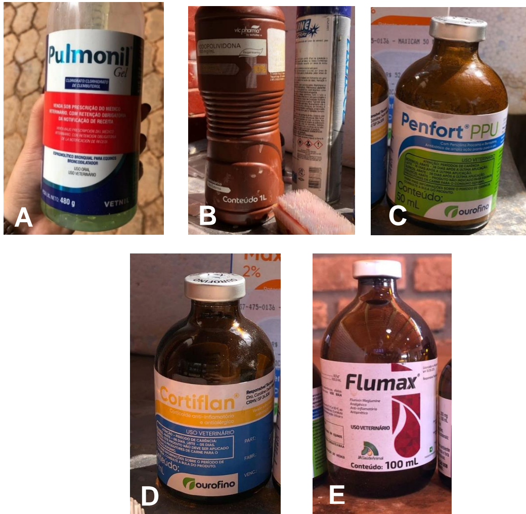
Figura 4 – Medicamentos utilizados: (A) Pulmonil Gel – broncodilatador e espasmolítico indicado no tratamento de doenças respiratórias caracterizadas por espasmos bronqueais; (B) Solução de Iodopovidona – antisséptico tópico utilizado na higienização de feridas e lesões; e spray prata (C) Penfort® PPU – antibiótico a base de penicilina procaína e penicilina benzatina indicado no tratamento de infecções bacterianas em animais; (D) Corticoide anti-inflamatório e antialérgico a base de Sulfato Sódico de Dexametasona, indicado para tratamento dos processos inflamatórios em geral. (E) Flumax – recomendado para animais com febre e dor.

Durante o acompanhamento do surto, foram observados três óbitos embora não tenha sido possível confirmar se ocorreram diretamente por complicações da doença. A maioria dos animais acometidos apresentou boa evolução clínica, com cicatrização das lesões e regressão dos sinais respiratórios (Figura 5), sugerindo que o protocolo terapêutico adotado foi eficaz, apesar das adversidades enfrentadas na contenção da disseminação.