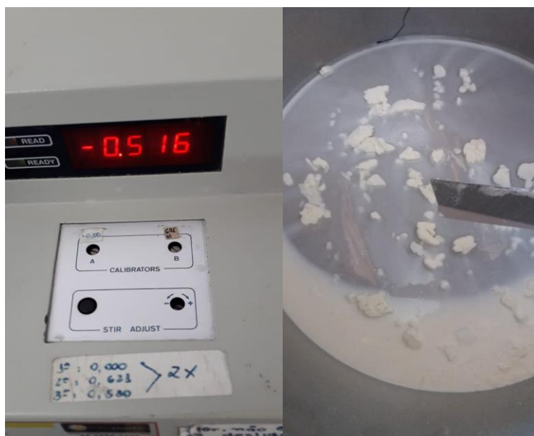
Foto 10: Resultado da análise de crioscopia e tanque de expansão com formação de gelo.

Esta foto correlaciona com as matérias de Tecnologia de Produtos de Origem Animal e Inspeção Sanitária de Produtos de Origem Animal, em que se estudam as principais alterações no leite e também com a matéria de Microbiologia Veterinária onde se estuda a multiplicação bacteriana e o efeito que elas podem causar no leite.