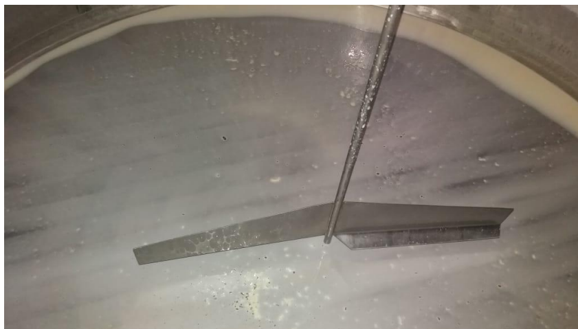
Foto 1: Tanque de expansão com presença de grumos de mastite clínica.

A qualidade do leite, é um dos principais serviços a serem realizados dentro de um laticínio, é feito por um profissional da área da Medicina Veterinária ou Zootecnia, que se baseia nas atuais normativas 76 e 77 criadas no ano de 2018. Dando auxílio ao produtor para melhorar requisitos básicos da composição do leite como CBT (Contagem Bacteriana Total), CCS (Contagem de Células Somáticas), gordura, proteína, lactose, ESD (Extrato Seco Desengordurado) e EST (Extrato Seco Total). A seguir será apresentada a foto 1 que mostra a realização do teste de CMT ( California Mastitis Test ):