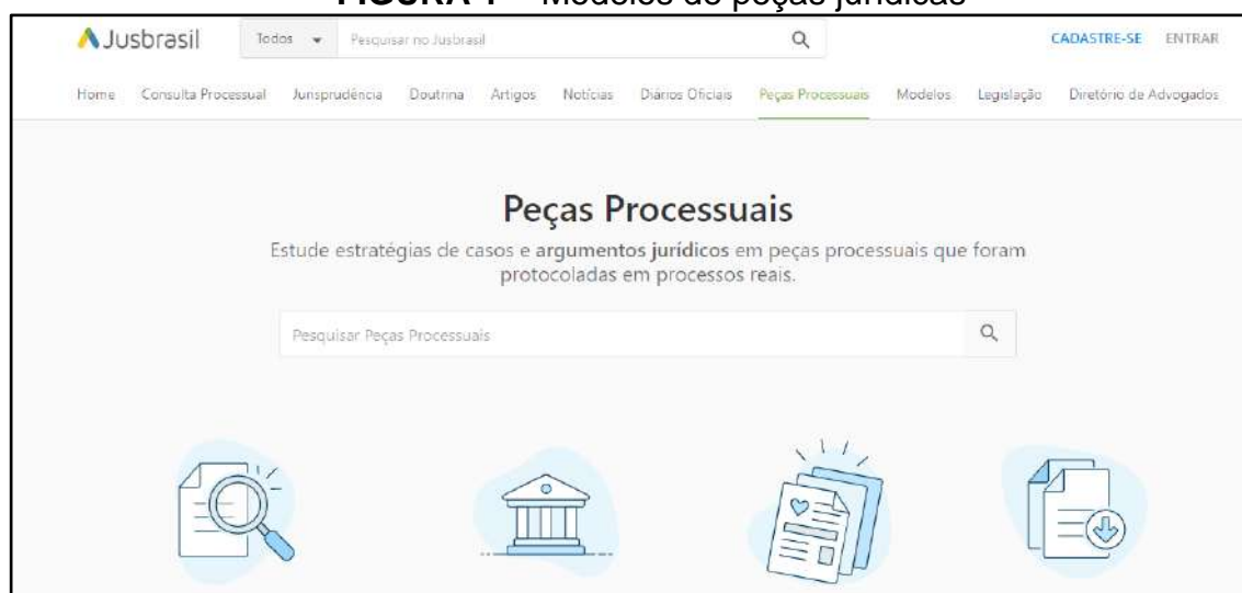
FIGURA 1 - Modelos de peças jurídicas

Assim, os estudantes, ao se defrontarem com esses textos e suas formas “rígidas”, tendem a atribuir valor de autoridade, performatividade e autonomia em textos que, em muitos casos, não são claros. A consequência aparece ainda quando esses estudantes estão “treinando” a escrita desses textos, por exemplo em provas, textos e trabalhos acadêmicos. Em sites da internet como o “Jusbrasil” 15 é possível encontrar “modelos” prontos de peças jurídicas, conforme mostra a Figura 1, abaixo.