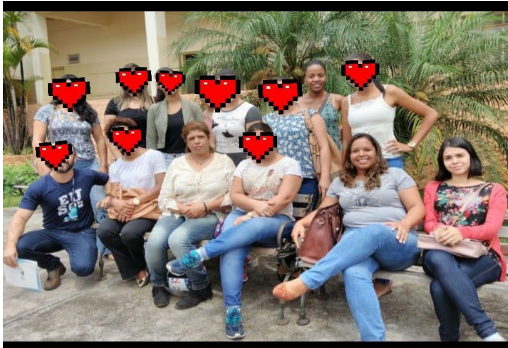
Figura 03 - Alunas e professor do Curso de Pedagogia em visita técnica à instituição de educação especial.

Na imagem a seguir estamos com nosso professor no pátio da instituição após conhecermos todas as suas dependências: