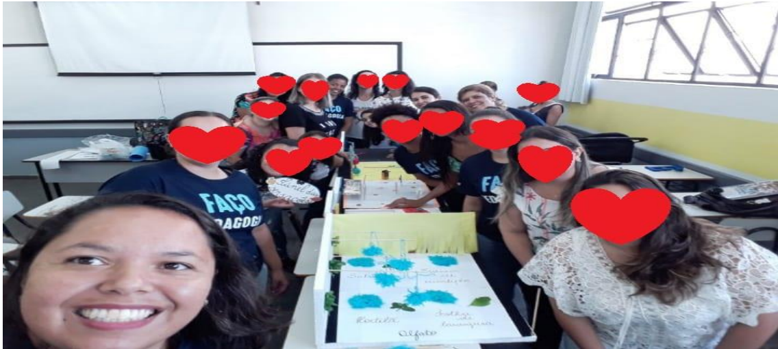
Figura 08 - Turmas do Curso de Pedagogia durante a confecção da maquete do Túnel de Sensações no Unilavras.