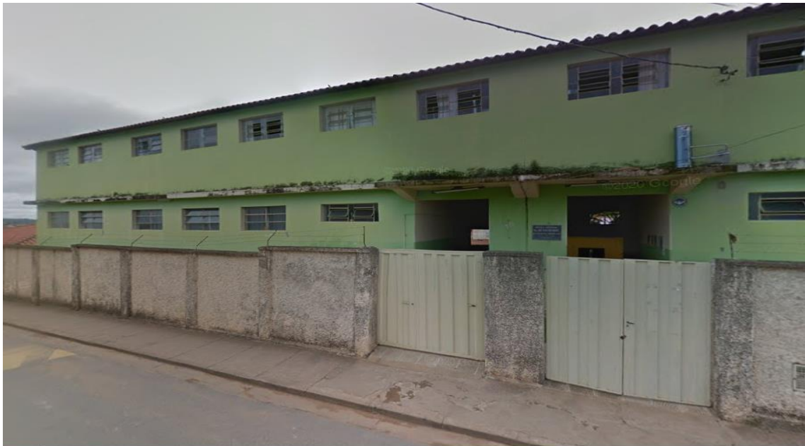
Figura 16 - Fachada da Escola Municipal onde foi realizado o Estágio Obrigatório Supervisionado no Ensino Fundamental I.

Nataliane relata que foi satisfatório e relevante o acompanhamento da aluna para sua formação pessoal e profissional, porém foi possível perceber algumas demandas neste processo: o prédio da escola é antigo e não possui infraestrutura adaptada para alunos com deficiência, afetando diretamente suas aprendizagens e a locomoção no espaço escolar. A seguir imagem da fachada da escola onde foi realizado a vivência do estágio: