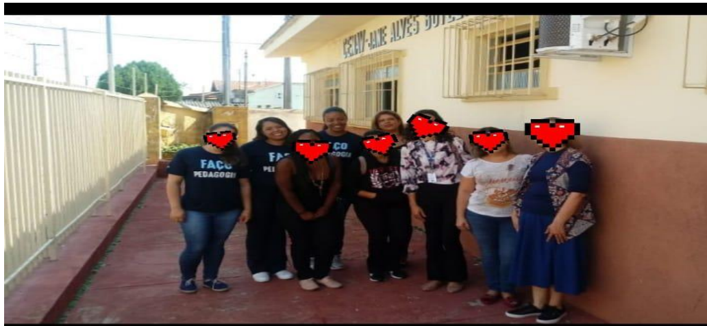
Figura 06 - Alunas, a professora de Libras do Curso de Pedagogia e a diretora da instituição se despedindo da visita.

A imagem a seguir marca o momento do término da nossa visita à instituição. Nos reunimos com a nossa professora de Libras e com a Diretora da instituição para registrar o momento: