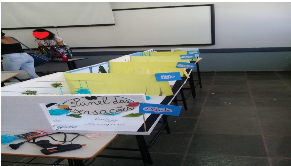
Figura 07 - Maquete do túnel das sensações realizada no encontro presencial, com metodologias ativas do Curso de Pedagogia do Unilavras em 2019.

Do planejamento até a execução passamos por momentos enriquecedores enquanto estudantes de Pedagogia. Foi preciso que houvesse uma parceria entre todas nós, para trabalharmos em grupos com diferentes colegas, inclusive de outras turmas, já que os mesmos foram montados pelas professoras e tivemos que conviver e nos entender para no final dar tudo certo. A seguir apresentamos uma imagem da maquete do túnel em processo de construção: