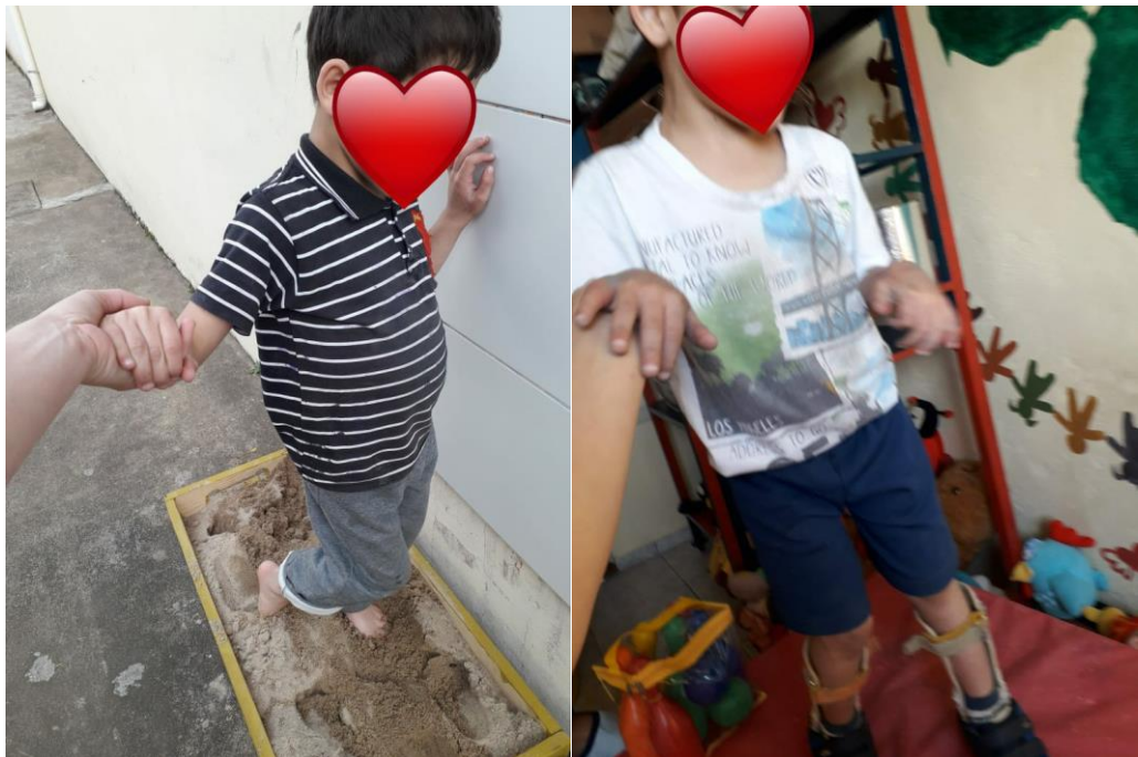
Figura 17 – Aluno realizando atividade psicomotora.