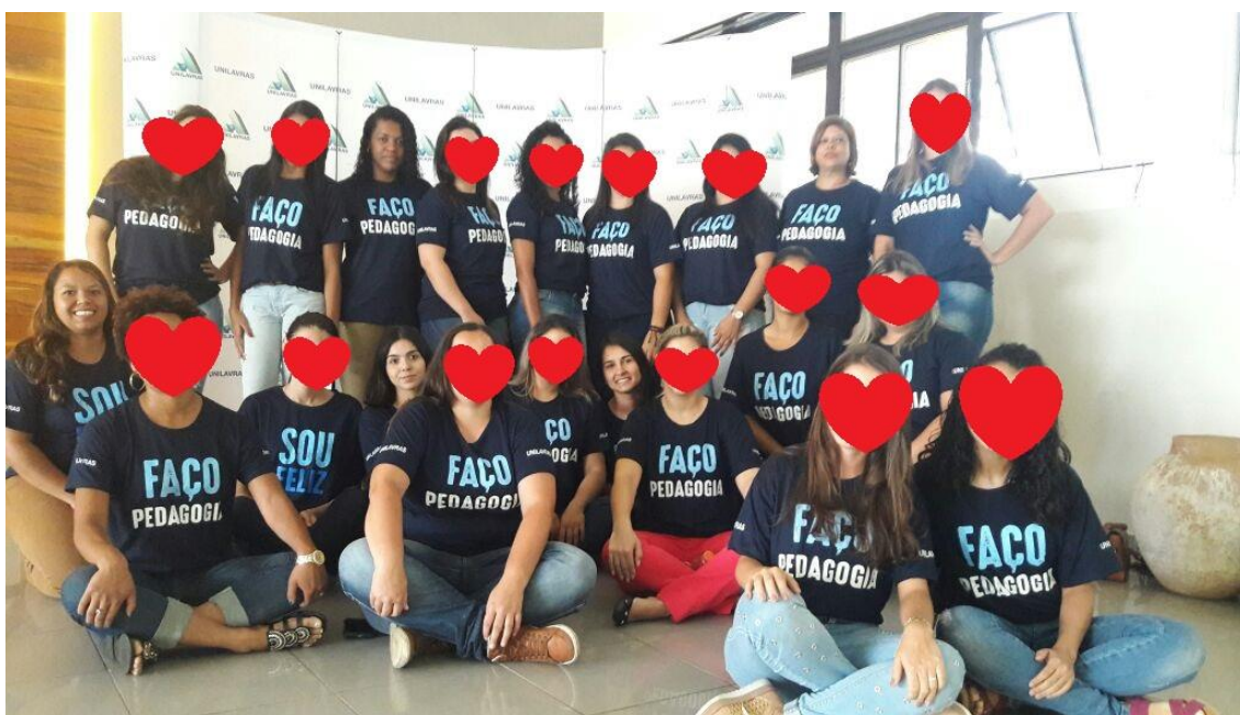
Figura 01 - Turma de Pedagogia (2017/2) no saguão do auditório do Unilavras.

Elas foram escolhidas de forma conjunta entre as seis integrantes do grupo. O objetivo foi apresentar nossas experiências, percepções e os conhecimentos adquiridos de forma interdisciplinar sobre o tema ao longo do Curso. A seguir nossa fotografia com a turma em 2017: