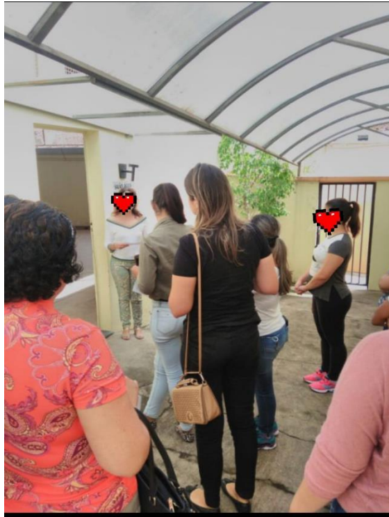
Figura 02 - Alunas conhecendo uma sala da instituição e recebendo orientações da responsável.