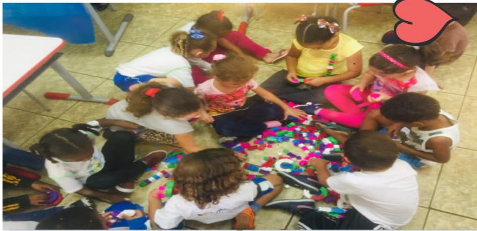
Figura 14 - Atividade de psicomotricidade com os alunos.

A próxima imagem retrata um momento acompanhado por Luísa, em que as crianças brincam e desenvolvem a coordenação motora com um jogo de montagem: