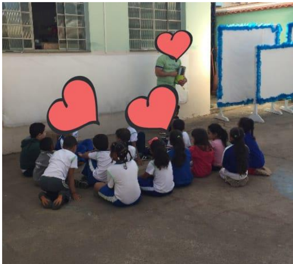
Figura 13 - Professor regente com a turma no pátio ouvindo histórias.

Na imagem a seguir o professor regente está com sua turma no pátio da escola enquanto realizava a contação de histórias: